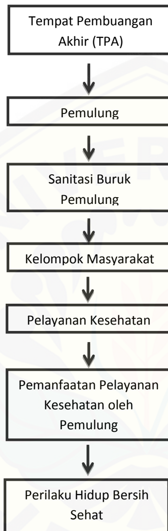
Bagan 2.2 Kerangka Berpikir