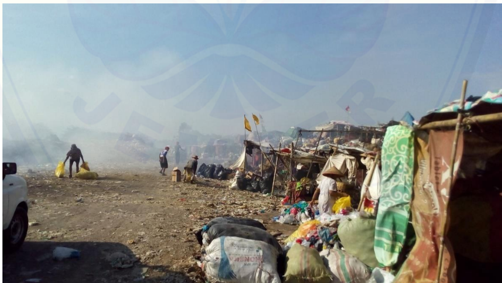
Kondisi lingkungan tempat memulung di dalam TPA Pakusari