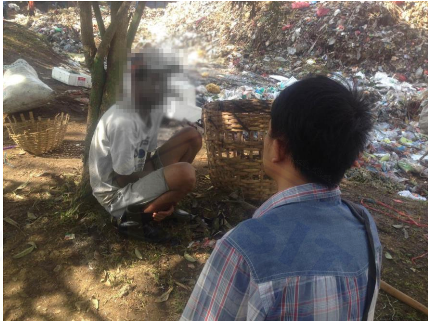
Wawancara dengan SN