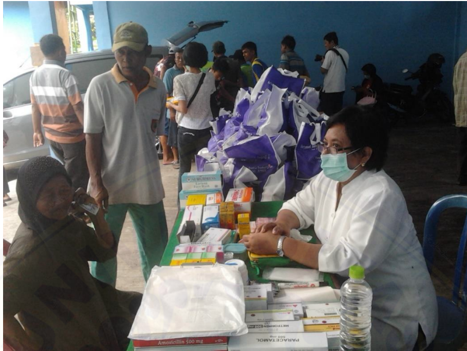
Bentuk Kegiatan Pelayanan Kesehatan dari Komunitas Jemaat GKI Jember