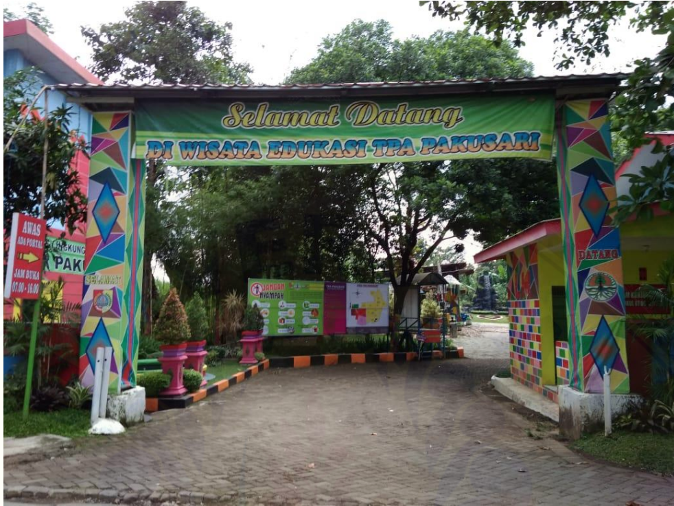
Pintu Masuk TPA Pakusari