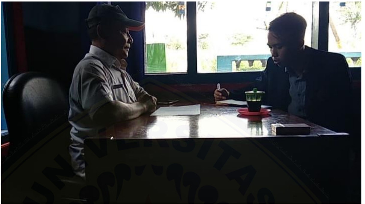
Wawancara dengan Pak Salis