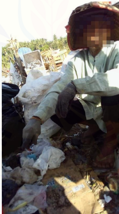
Wawancara dengan M