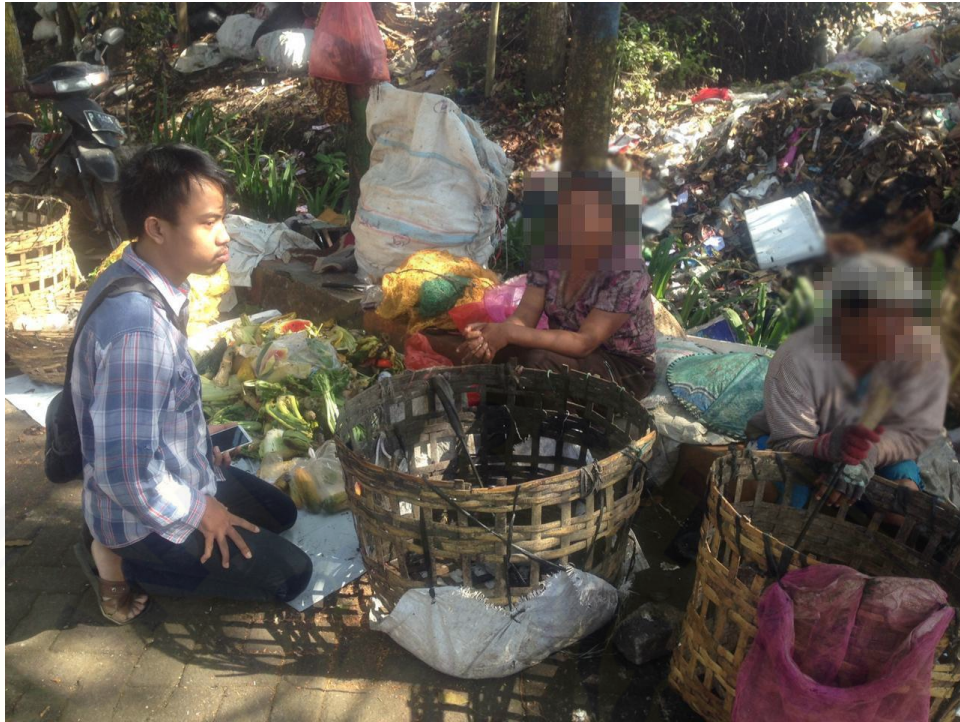
Wawancara dengan IS dan RF