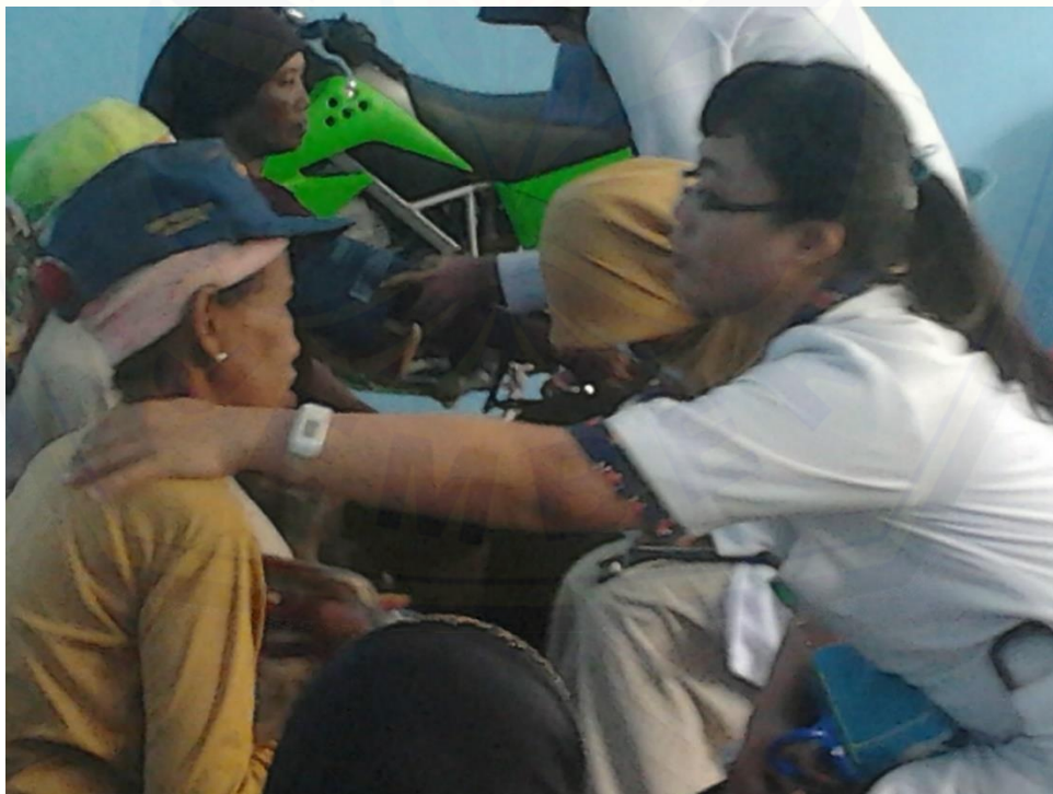
Dokter dari Komunitas Jemaat GKI Jember yang sedang memeriksa kesehatan pemulung