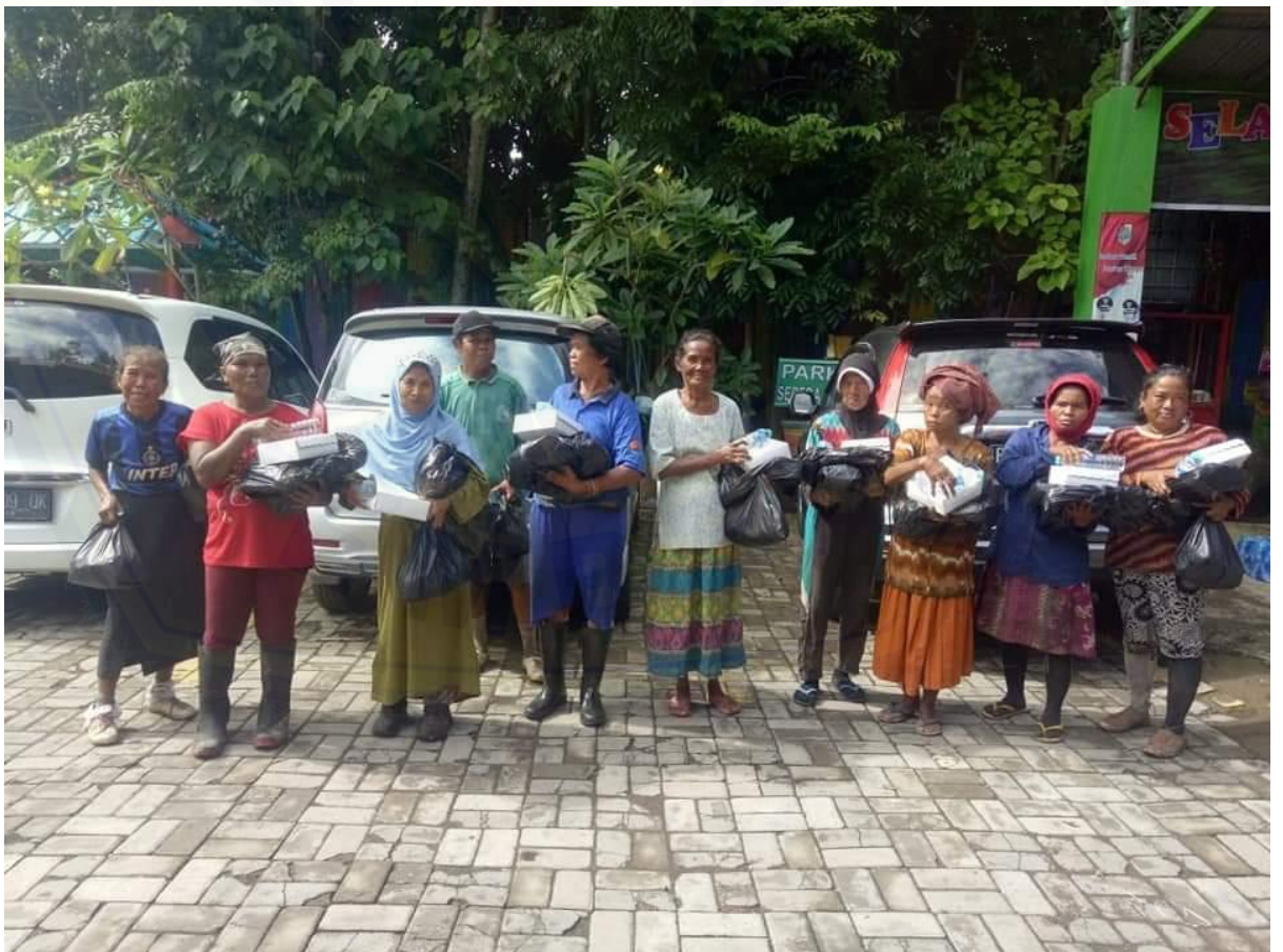
Pemulung yang menerima bantuan dari Better Community