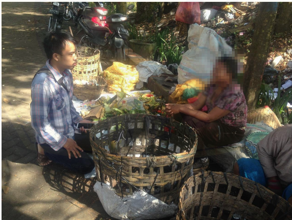
Wawancara dengan IS