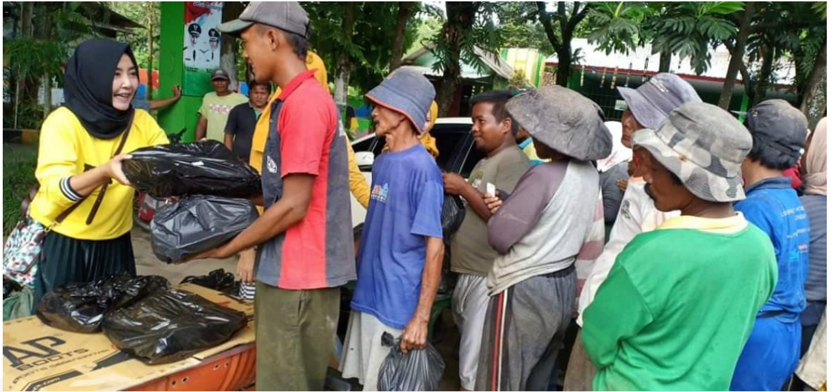
Bentuk Kegiatan Pelayanan Kesehatan dari Better Community