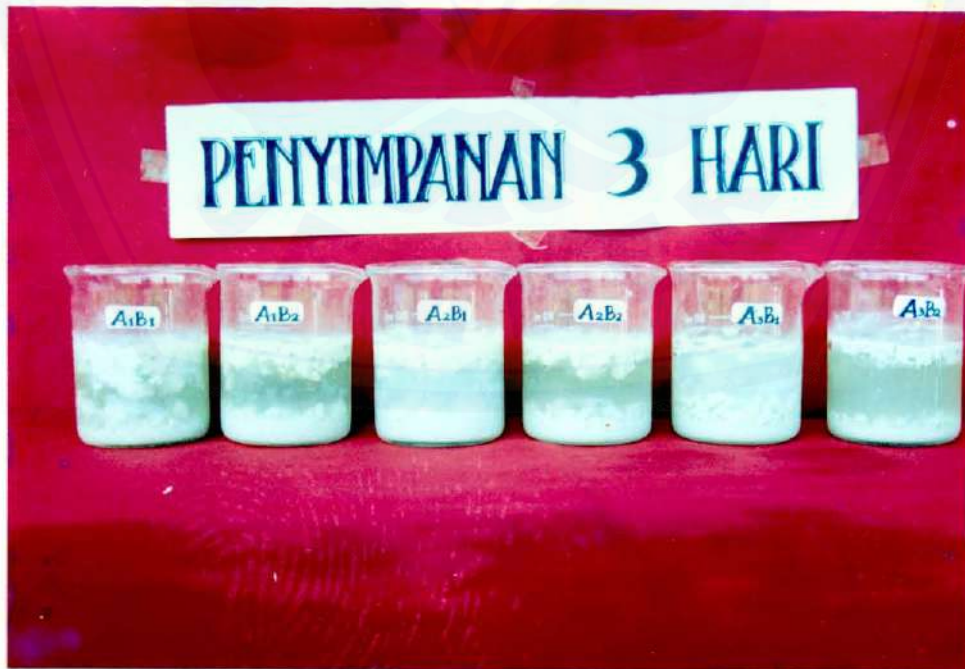
Kondisi Fisik Susu Kedelai Edamame pada Penyimpanan 3 Hari