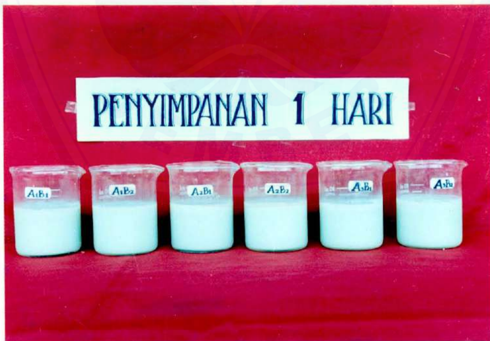
Kondisi Fisik Susu Kedelai Edamame pada Penyimpanan 1 Hari