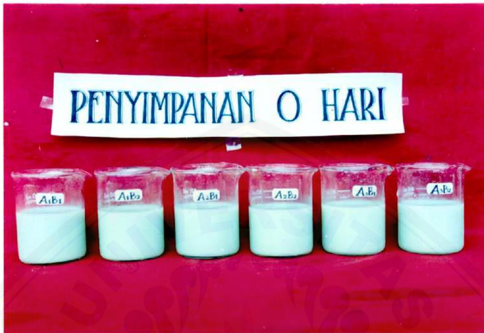
Kondisi Fisik Susu Kedelai Edamame pada Penyimpanan 0 Hari