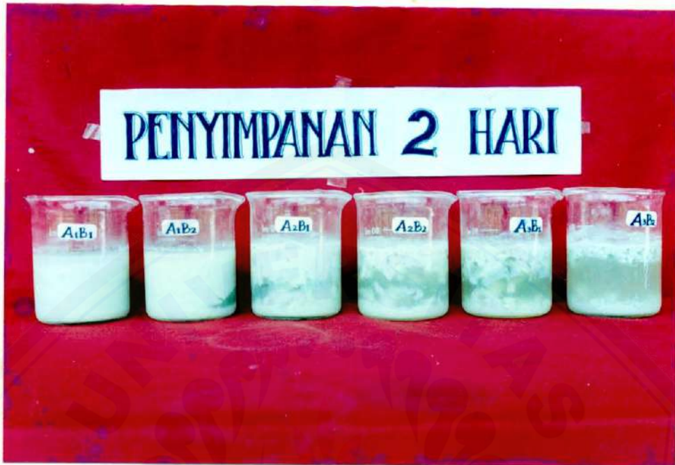
Kondisi Fisik Susu Kedelai Edamame pada Penyimpanan 2 Hari