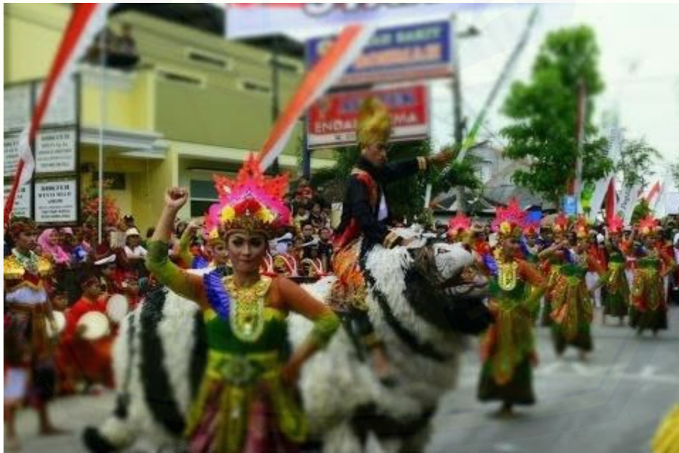
Salah Satu Tradisi Memperingati Maulud Nabi