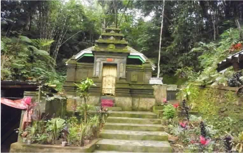
Petilasan Prabu Tawang Alun