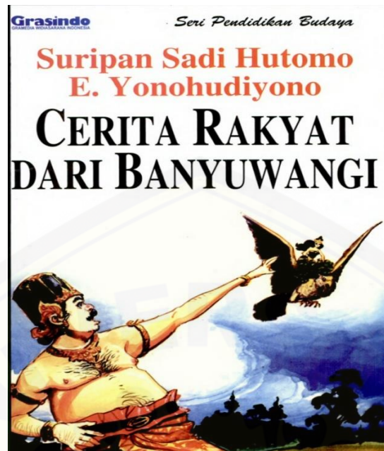
Buku Cerita Rakyat Banyuwangi