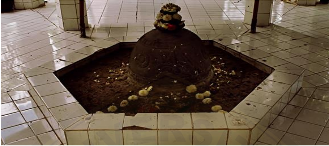
Tampak dalam Petilasan Prabu Tawang Alun di Desa Macan Putih