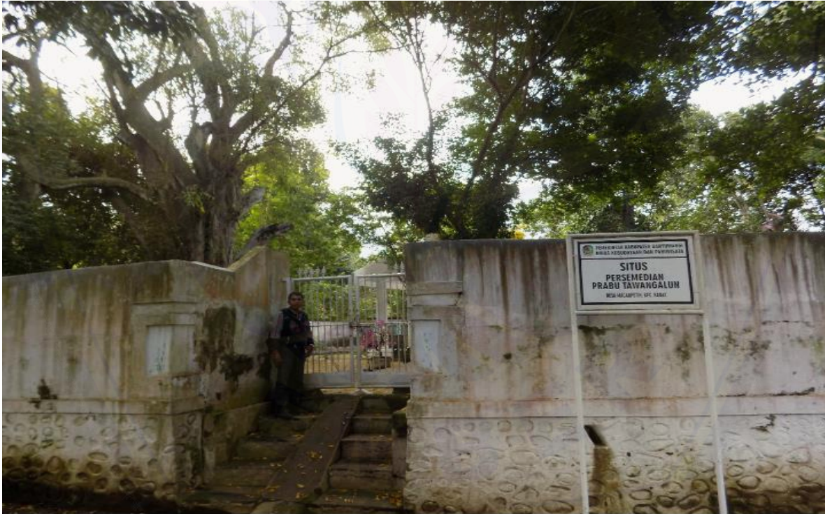
Pintu Gerbang Petilasan Prabu Tawang Alun Di Desa Macan Putih