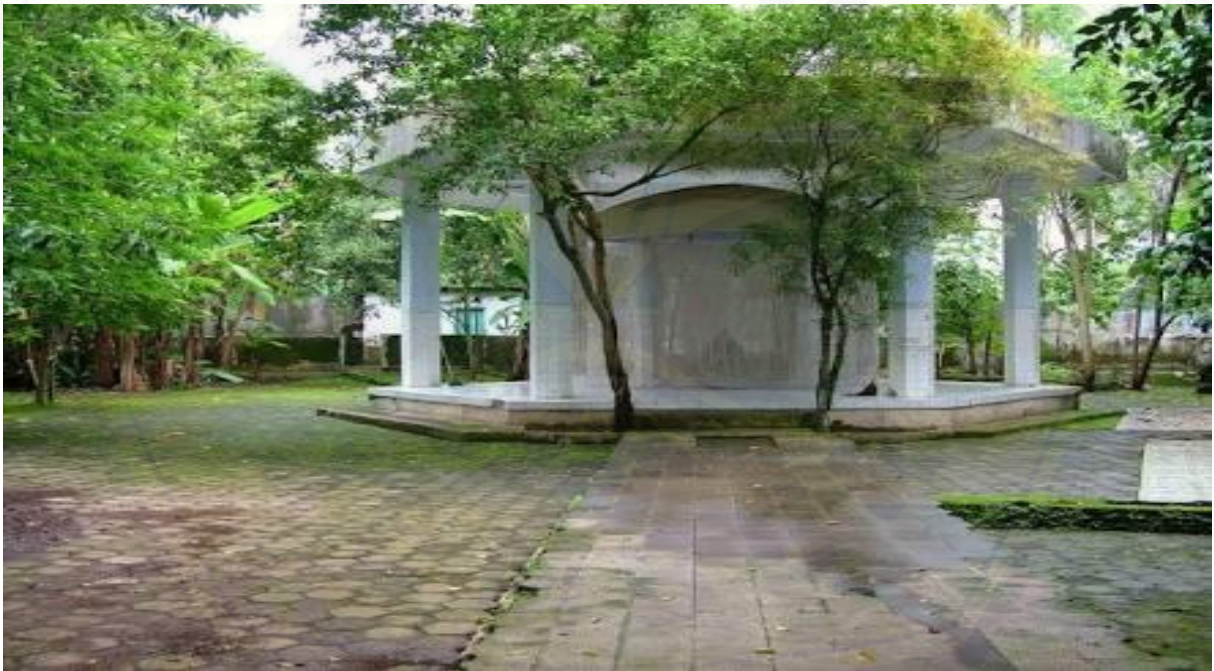
Petilasan Prabu Tawang Alun