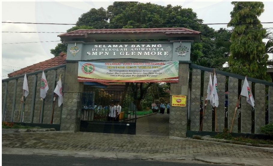
Sekolah SMPN 1 Glenmore Glenmore – Banyuwangi