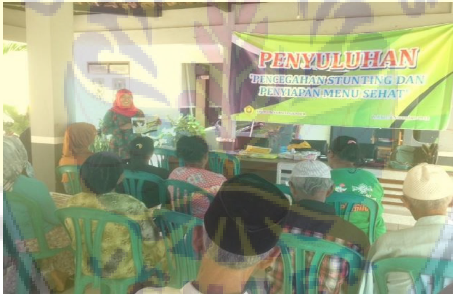
Gambar 1. Penyuluhan tentang stunting dan bahayanya di Balai desa Sukogidri

Kegiatan berikutnya yang dilakukan adalah penyuluhan tentang upaya mencegah stunting dan pelatihan penyiapan menu sehat. Kegiatan dihadiri oleh 30 peserta yang terdiri dari perangkat desa, petugas kesehatan, kader posyandu, ibu-ibu. Upaya yang dilakukan untuk mencegah stunting antara lain mengkonsumsi makanan dengan gizi seimbang untuk ibu hamil, melakukan pemeriksaan minimal 4 kali selama kehamilan untuk ibu hamil, memberikan stimulasi untuk janin dalam kandungan, memberikan ASI eksklusif, dilanjutkan dengan makanan pendamping ASI (MP-ASI) sampai 2 tahun, mengenalkan makanan bergizi pada anak sesuai dengan usia, dan memberikan stimulasi kepada anak sesuai usia dan memantau perkembangan anak dengan kartu kembang anak (KKA); dimana kegiatan tersebut dilakukan pada 1000 hari pertama kelahiran (HPK). Selain itu, juga dilakukan kegiatan pelatihan penyiapan menu sehat, dalam hal ini dilatih menyiapkan menu puding labu mawar jeruk. Resep ini dipilih karena banyak labu dihasilkan di Desa Sukogidri dan belum dimanfaatkan dengan baik karena pengolahannya yang terbatas. Semua bahan dapat ditemukan dengan mudah di Desa Sukogidri, proses pembuatannya juga mudah dan menghasilkan bentuk dan cita rasa yang disukai anak-anak, sehingga dapat dikonsumsi anak-anak untuk memperbaiki status gizi anak stunting . Resep diajarkan untuk diterapkan pada kegiatan posyandu.