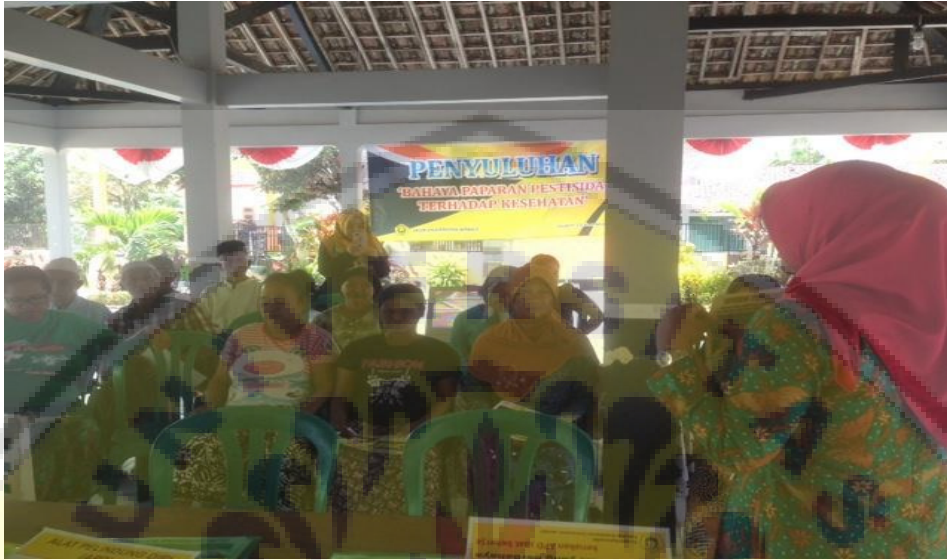
Gambar 2. Penyuluhan tentang bahaya paparan pestisida dan pemeriksaan kesehatan di Balai desa Sukogidri

celana panjang, sarung tangan, masker, penutup kepala dan sepatu. Upaya lain adalah dengan menyempatkan pestisida sesuai dengan arah angin yang bertiup. Kegiatan diikuti dengan pemeriksaan kesehatan meliputi tekanan darah, denyut nadi, frekuensi nafas dan gula darah acak. Ditemukan beberapa orang mempunyai tekanan darah tinggi dan gula darah yang tinggi, untuk mereka disarankan ke puskesmas untuk mendapat pemeriksaan dan pengobatan lebih lanjut.