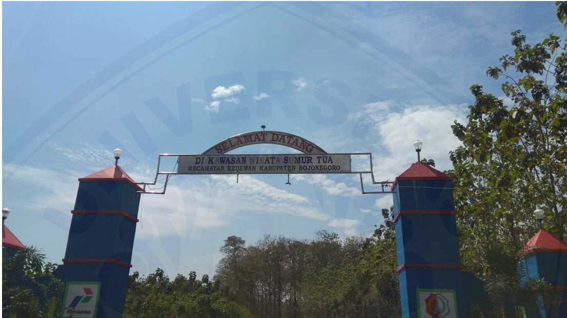
Gambar 1. Gerbang Masuk Wisata Wonocolo