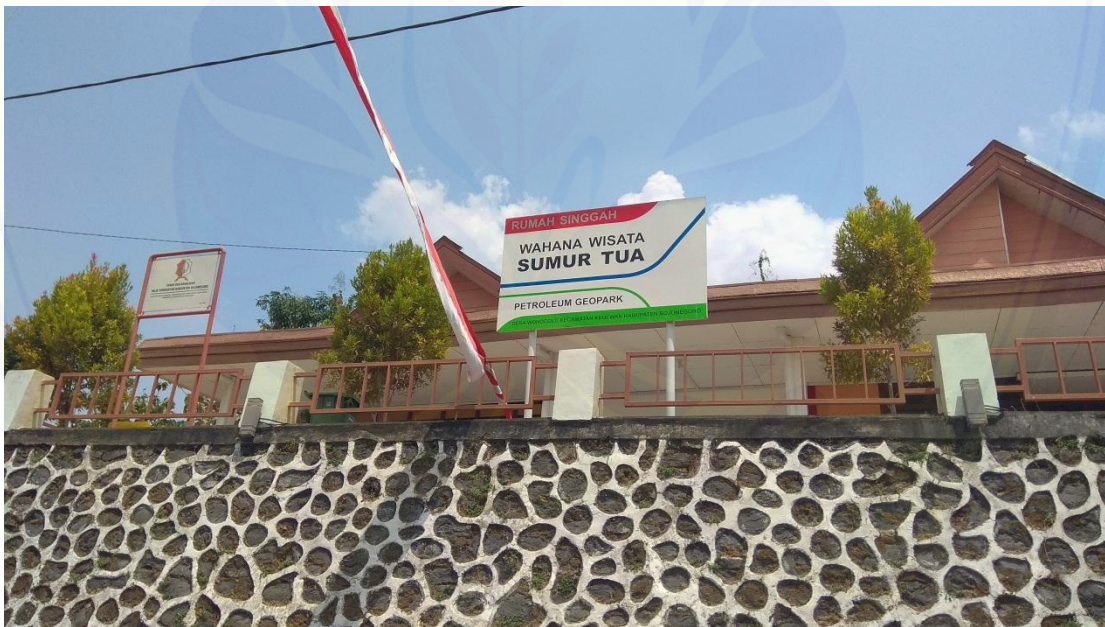
Gambar 4. Rumah Singgah Wisatawan