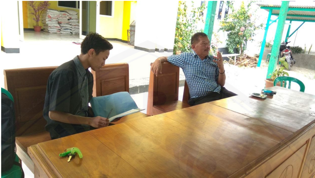
Gambar 3. Pengisian Angket oleh Responden