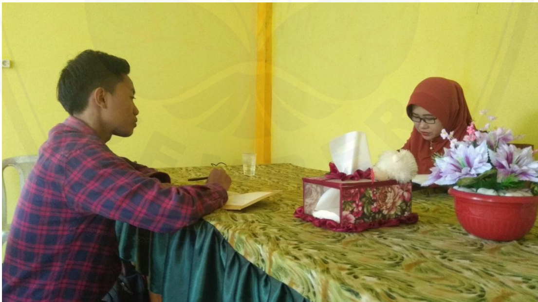
Gambar 2. Pengisian Angket oleh Responden