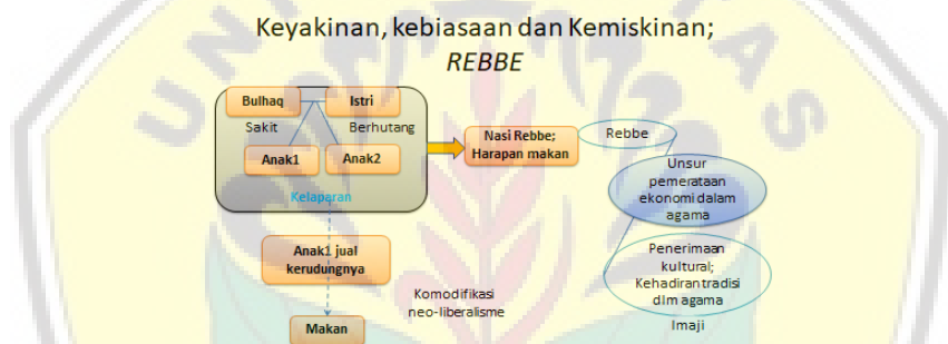
Gambar 2. Diagram peristiwa dalam cerpen Rebbe

Dari perspektif pesantren pun kisah tersebut tidak dimurnikan tetapi justru menunjukkan sisi kemanusiaan yang berkeadilan sosial dalam tradisi yang masih sesuai dengan ajaran Islam. Model tulisan seperti Rebbe ini menjadi potensial menyebarkan keharmonisan hubungan dengan Allah dan hubungan antarmanusia, antara perihal ketuhanan dan kemanusiaan yang mengoposisi radikalisme. Unsur kultural mempunyai potensi melemahkan pemikiran radikal.