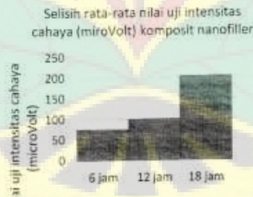
Gambar 2. Histogram selisih rata-rata nilai uji intensitas cahaya (microVolt) komposit nanofiller

Data hasil penelitian kemudian ditabulasi, dan diuji distribusi normalitasnya dengan uji Kolmogorov-Smirnov. Hasil yang didapatkan p > 0,05 artinya data tersebut terdistribusi normal. Selanjutnya dilakukan uji komparatif Paired-T Test, menunjukkan nilai