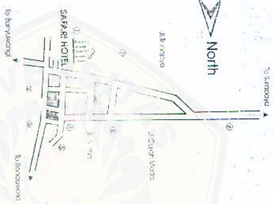
Map Of Safari Hotel