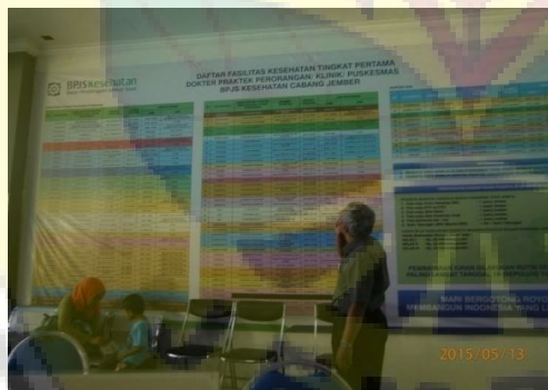
Gambar 1. Peserta BPJS Kesehatan mencari fasilitas pelayanan kesehatan.

Penjelasan informan tersebut menunjukkan bahwa untuk masyarakat yang mendaftar secara mandiri, polanya bermacam-macam diantaranya mendaftar sebagai peserta BPJS Kesehatan kalau sakit. Sedangkan pada waktu kondisi dalam keadaan sehat tidak mendaftar. Dengan adanya pola mendaftar yang demikian ini BPJS Kesehatan banyak berkorban, karena sakit sekarang oleh BPJS Kesehatan dijamin sekarang. Dengan pola mendaftar jika pada saat sakit ini BPJS Kesehatan banyak mengalami tekor, seperti disampaikan bahwa pada bulan juni sampai Juli 2014 BPJS Kesehatan mengalami tekor atau berkorban.