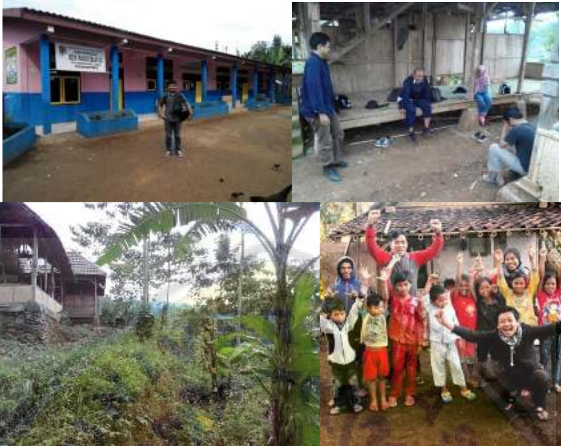
Gambar 1. Foto pengusul saat kegiatan assesment pertama yang melibatkan peserta didik dan warga dusun Sumber Candik di komunitas Sokola Kaki Gunung, SD Panduman 03 dalam foto berjarak sekitar 3 km dari lokasi peserta didik. Dalam Foto tampak padepokan yang dimanfaatkan komunitas untuk menggelar kegiatan belajar mengajar. Saat foto diambil, komunitas Sokola Kaki Gunung belum memiliki basecamp milik mereka sendiri.

Berdasarkan kondisi tersebut, beberapa komunitas di kota Jember menggagas untuk melakukan gerakan pemberantasan buta huruf, khususnya di daerah-daerah pedesaan. Salah satu gerakan yang cukup populer pada tahun 2014 adalah Gerakan Bebas Buta Aksara Jember (GEBRAK). Namun selain memberantas buta huruf, kualitas pendidikan yang rendah ternyata membutuhkan perhatian lebih baik. Pada awal 2016, salah satu komunitas di kota Jember membuka pendidikan alternatif di wilayah Sumbercandik, Desa Panduman, Kecamatan Jelbuk tersebut. Komunitas yang saat ini sedang aktif melakukan gerakan ini adalah komunitas 'Sekolah Kaki Gunung'. Dengan tiga orang pengajar aktif, mereka menggelar kelas belajar-mengajar pada pukul 14.00 - 16.00 WIB untuk peserta usia 7 - 15 tahun sebanyak 20 - 25 orang dan pukul 19.00 - 21.00 untuk peserta usia 40 - 55 tahun sebanyak 10 - 15 orang.