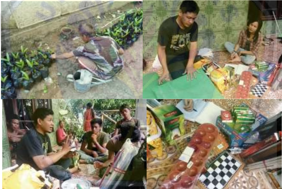
Gambar 9. Barang barang infrastruktur untuk mendukung kegiatan belajar mengajar. Dalam kegiatan ini juga dijelaskan metode pemakaian, dan pemanfaatannya bagi peserta didik. Selain itu juga dilakukan inventaris terhadap barang-barang tersebut.

Ketercapaian target materi pada kegiatan ini cukup baik, karena silabus dan media pembelajaran telah dapat disempurnakan dan dikembangkan secara keseluruhan. Prosedur yang ditempuh dalam pengembangan silabus dan media pembelajaran dalam kegiatan ini menggunakan prosedur pengembangan desain pembelajaran model Dick & Carey. Dalam pemahaman tradisional, proses belajar dan mengajar melibatkan, guru, siswa, dan buku teks. Materi pelajaran yang akan diajarkan oleh guru telah termuat dalam buku teks. Pandangan ke depan tentang pembelajaran, merupakan suatu proses sistematis yang melibatkan komponen-komponen yang saling terkait, seperti: pebelajar, pengajar, bahan pembelajaran, dan lingkungan belajar, semua ini merupakan hal yang penting untuk kesuksesan belajar.