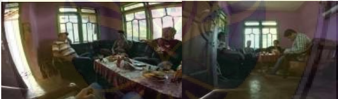
Gambar 8. Foto pengusul saat kegiatan pembahasan silabus pembelajaran. Kegiatan dilakukan di kediaman Pak Dur yang seringkali menjadi tempat transit bagi pengusul setiap kali melakukan kegiatan.

Program pengabdian pada masyarakat berupa pelatihan pengembangan silabus pembelajaran bagi para relawan/guru pendidikan alternatif ‘Sokola Kaki Gunung’ Dusun Sumbercandik, Desa Panduman, Kecamatan Jelbuk, Kabupaten Jember yang sudah dilaksanakan ini diharapkan dapat menambah pengetahuan, keterampilan dan lebih percaya diri dalam menjalankan profesinya. Relawan/guru akan lebih semangat dan termotivasi untuk mengembangkan diri. Hasil pelatihan ini akan bermanfaat bagi sekolah alternatif, proses belajar-mengajarnya akan lebih menarik dengan digunakannya silabus pembelajaran yang relevan serta media pembelajaran yang lebih bervariasi. Di samping itu dengan adanya pelatihan pengembangan silabus pembelajaran ini akan menambah keterampilan relawan/guru dalam menyiapkan perangkat pembelajarannya sehingga akan mendukung kemampuan mereka dalam menyiapkan proses belajar-mengajar selanjutnya.