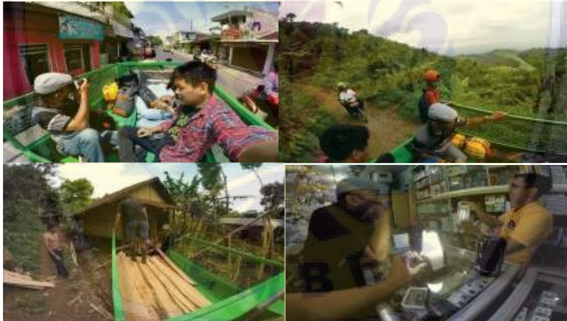
Gambar 5. Proses pembelian dan pengiriman bantuan infrastruktur bagi kegiatan belajar mengajar untuk komunitas Sokola Kaki Gunung. Proses pengiriman menggunakan kendaraan roda 3 untuk mengangkut pengusul dan barang-barang tersebut.

Kegiatan Pengabdian Pembinaan Pendidikan Alternatif “Sokola Kaki Gunung” meliputi dua kegiatan yaitu: pertama, mengadakan pelatihan mengenai manajemen pendidikan alternatif dan pembuatan silabus pengajaran sesuai dengan assesment dengan peserta didik dan warga dusun