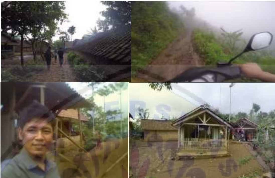
Gambar 2. Foto pengusul saat kegiatan assesment. Menuju lokasi kegiatan melewati lereng bukit curam dengan jurang dan area yang berkabut. Tampak dalam foto adalah suasana desa dan musholla tempat komunitas Sokola Kaki Gunung melaksanakan kegiatan belajar mengajar.

Kendala yang seringkali dijumpai oleh komunitas ini adalah peserta didik yang lebih terbiasa menggunakan bahasa daerah Madura dan sebagian besar warga yang tidak dapat berbahasa Indonesia. Meskipun sebagian besar peserta didik fasih membaca Al-Quran, namun beberapa dari mereka yang bahkan sudah menginjak kelas 4 SD, belum bisa membaca aksara latin. Hal inilah yang menyebabkan penyusunan silabus pembelajaran menjadi rumit, karena harus menyusunnya sesuai dengan kemampuan faktual para peserta didik.