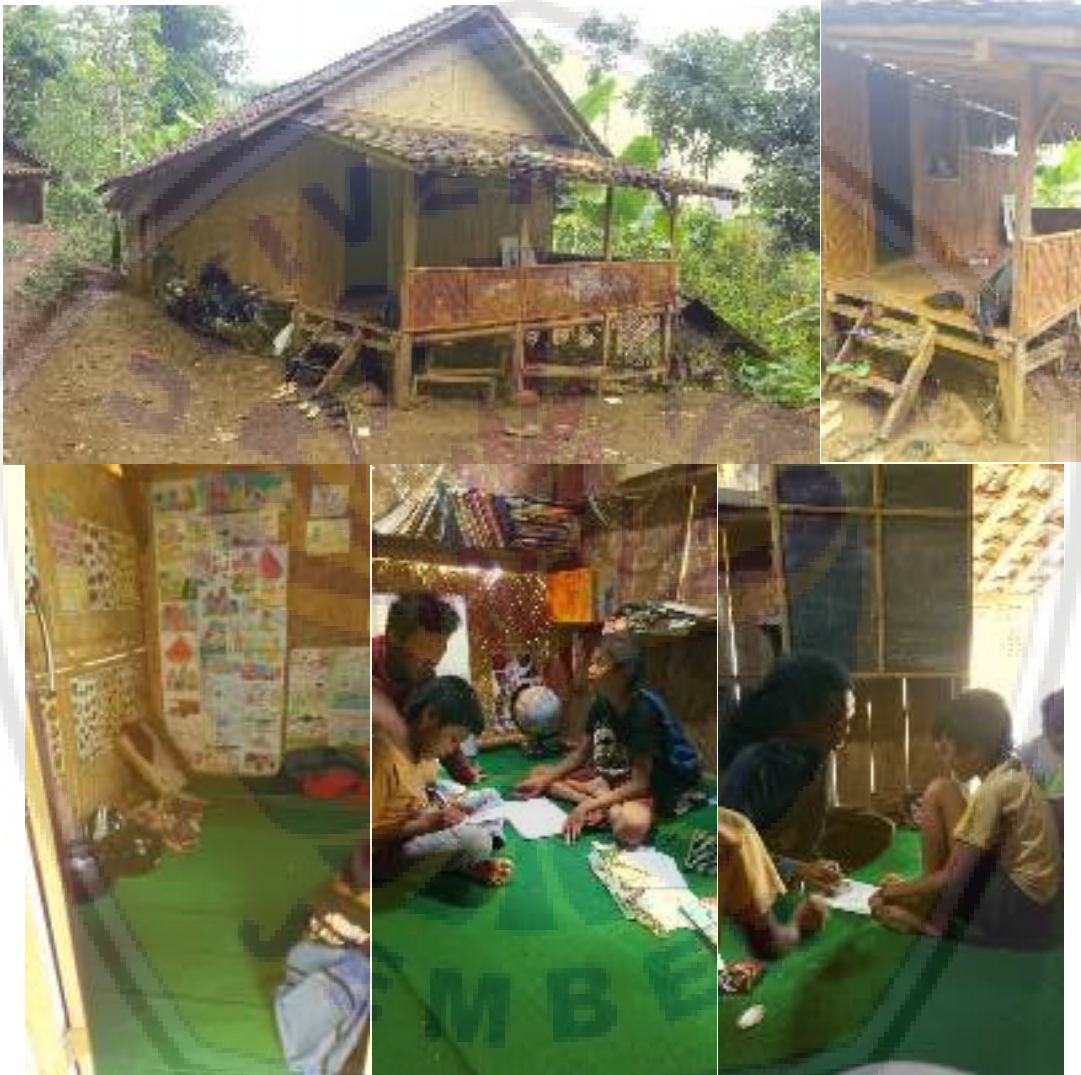
Gambar 10. Foto basecamp Sokola Kaki Gunung setelah selesai dikerjakan dan dimanfaatkan untuk kegiatan belajar mengajar. Seluruh infrastruktur pendukung telah dimanfaatkan sepenuhnya untuk mendukung proses kreatif bagi guru dan peserta.

Kegiatan pengembangan silabus dan media pembelajaran untuk pendidikan alternatif ‘Sokola Kaki Gunung’ Dusun Sumbercandik ini dapat dikatakan berhasil. Keberhasilan ini selain diukur dari berbagai komponen di atas, juga dapat dilihat dari kepuasan para relawan/guru setelah mengikuti kegiatan. Manfaat nyata yang mereka peroleh adalah dapat menyusun dan mengembangkan silabus pembelajaran dengan kualitas yang lebih baik.