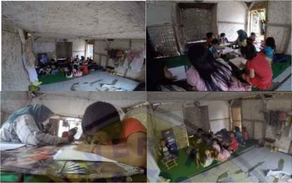
Gambar 4. Kegiatan belajar mengajar yang dilakukan di musholla desa membutuhkan infrastruktur yang lebih layak. Kegiatan ini dilakukan setiap sore atau malam dengan lokasi yang berpindah pindah.

gempuran alat-alat permainan modern. Konsep bermain sambil belajar akan diterapkan dalam konsep pendidikan ini.