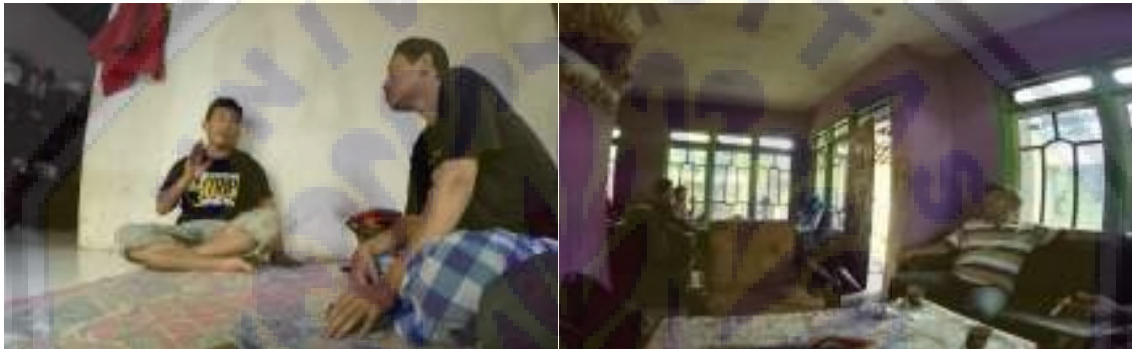
Gambar 3. Foto pengusul saat kegiatan pembahasan silabus pembelajaran. Dalam kegiatan ini ditemukan bahwa kegiatan belajar mengajar nantinya akan meliputi pendidikan dasar bagi usia anak-anak dan pendidikan terapan bagi usia dewasa.

Selain itu komunitas ini juga membutuhkan perbaikan silabus pembelajaran, baik untuk jangka pendek maupun jangka panjang. Saat ini penyusunan silabus hanya didasarkan pada pendidikan dasar dan pendidikan terapan, dan kurang maksimalnya proses assesment pada peserta didik karena rentang perbedaan usia peserta didik yang cukup besar. Dengan perbaikan silabus ini diharapkan proses belajar-mengajar akan lebih terstruktur dan dapat diterapkan sistem evaluasi capaian pembelajaran.