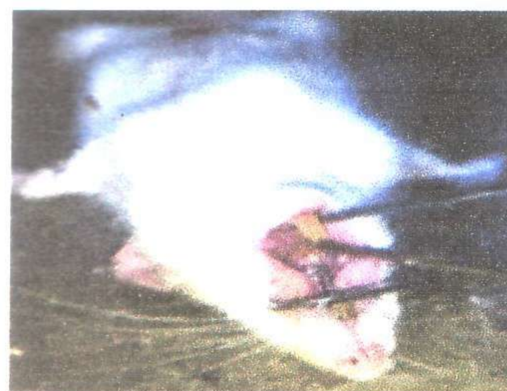
Gambar 1. Pemasangan closed coil spring pada tikus

diberi kawat ligatur dengan diameter 0,20 mm. Kemudian M-1 RA kanan digerakkan ke mesial menggunakan Tension Gauge untuk menghasilkan kekuatan 10 g/cm 2 dengan Nickel Titanium Orthodontic closed coil spring panjang 6 mm 13 . Pengamatan dilakukan dengan cara tikus dikorbkan pada hari ke 15 dan diambil kedua gigi M1-1 dan M-2 RA kanan beserta jaringan periodontalnya. Selanjutnya dilakukan pemeriksaan histologi untuk menghitung jumlah osteoklas dan pemeriksaan iminohistokimia untuk menentukan ekspresi RANKL. Data dianalisis dengan menggunakan Student's t-test , paired t-test , dengan tingkat kepercayaan 95% ( \alpha = 0,05 ). Pemasangan closed coil spring pada tikus ditunjukkan pada Gambar 1.