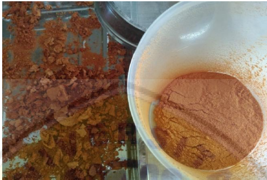
Gambar2. Tomat yang telah dikeringkan dan serbuk tomat