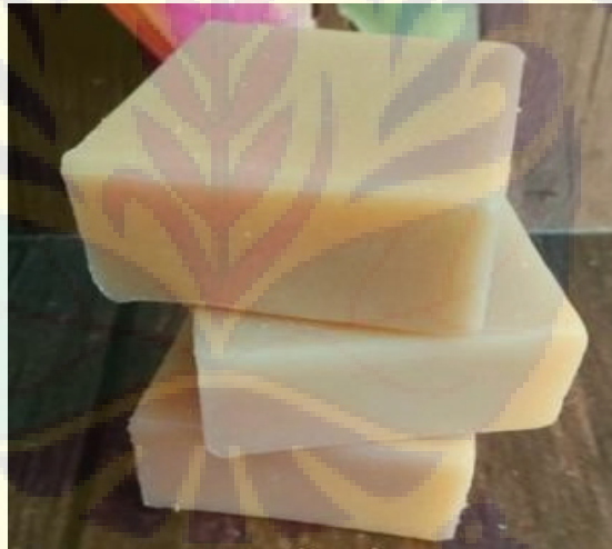
Gambar3. Produk sabun tomat