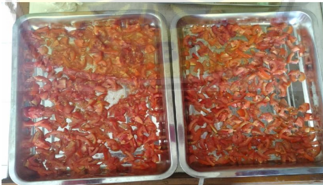
Gambar1. Tomat yang telah diiris dan siap dikeringkan

Pada program ini juga dilakukan kegiatan pendampingan pada awal masa produksi dan selama kegiatan produksi berlangsung. Sedangkan, kegiatan evaluasi dilaksanakan antara tim pelaksana dengan mitra kelompok petani tomat mulai dari sosialisasi program hingga pendampingan. Selama pelaksanaan kegiatan ini, ketua kelompok petani tomat berpartisipasi dengan menyiapkan lokasi pelaksanaan kegiatan dan mengkoordinasi anggota kelompok petani tomat di Desa Dawuhan untuk menghadiri seluruh kegiatan yang telah diprogramkan. Dengan adanya kegiatan ini, diharapkan dapat meningkatkan kesejahteraan para petani tomat bahkan dapat membantu perekonomian masyarakat sekitarnya bila usaha ini nantinya dapat berkembang dengan baik.