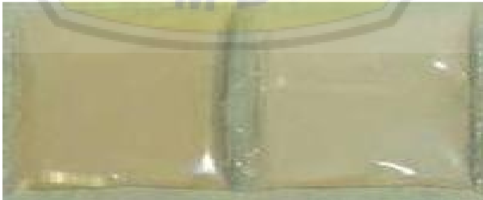
Gambar4. Produk lulur tomat