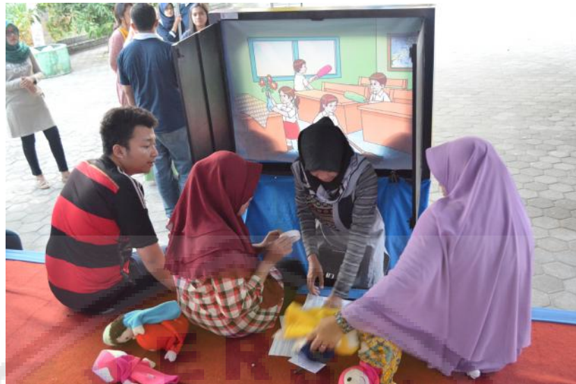
Gambar 2. Persiapan H-1 dan gladi bersih kegiatan

Selain materi tentang GTS materi lain yang disampaikan berkaitan dengan PHBS sehari-hari yang dilakukan anak Indonesia salah satunya dengan cuci tangan yang baik dan benar menggunakan sabun dan air mengalir dengan tahapan sebagai berikut: