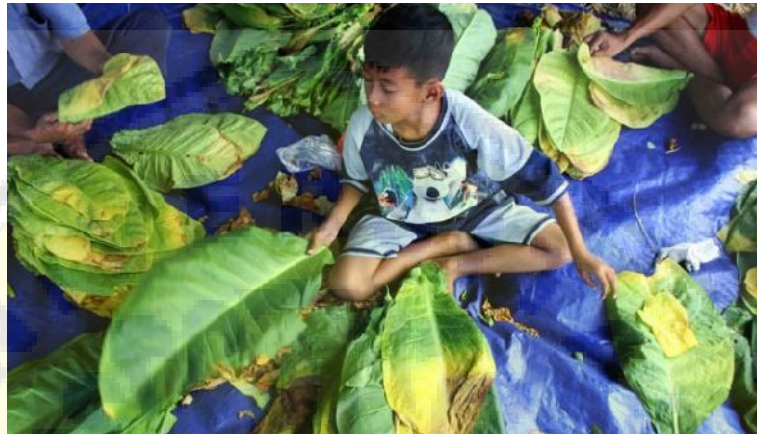
Gambar 1. Seorang anak membantu orang tuanya memisahkan daun tembakau usai dipetik di wilayah Jawa Tengah

Beberapa jenis tembakau kelas dunia ditanam di lahan pertanian Kota Bersinar tersebut. Tembakau itu di antaranya jenis Virginia, Vorstland dan beberapa jenis tembakau lainnya. Tembakau-tembakau tersebut tumbuh subur di sepanjang lahan pertanian di Klaten (PT. Pandu Sapta Utama, 2017).