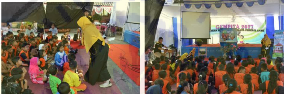
Gambar 3 Acara Edukasi Pada Anak Saat Sedang Berlangsung

Dengan berbagai karakter boneka tangan disambung dengan dialog yang mudah dipahami tentang pentingnya bersekolah serta menghindari bahaya pelecehan seksual pada anak menjadikan antusias tersendiri bagi siswa siswi serta para guru yang mendampingi mereka. Diakhir kegiatan perusahaan juga menyediakan dan membagikan berbagai souvenir sebagai door prize bagi anak-anak yang aktif dalam kegiatan.