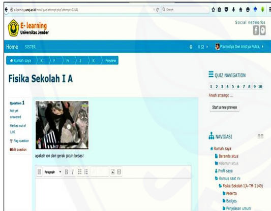
Gambar 2 Salah satu contoh bentuk tampilan real life video evaluation menggunakan sistem e-learning

Berdasarkan tabel 2 didapatkan indikator yang telah ditentukan dalam berpikir kritis adalah melingkupi kegiatan menginterpretasi, menganalisis, mengevaluasi dan menginferensi. Langkah berikutnya adalah melakukan tes kepada 45 siswa untuk mengetahui penguasaan digital literasi menggunakan sistem e-learning. Instrumen tes digital literasi yang digunakan menggunakan skala likert dimana pilihan 4 = sangat baik, 3 = baik, 4= kurang dan 1 buruk. Instrumen tersebut telah dilakukan uji cronbachs alpha untuk menentukan konsistensi konstruktif dengan nilai \alpha = 0,922 . Uji lieterasi digital ini dilakukan sebagai bentuk meminimalisasi kurang siapnya mahasiswa dalam melakukan pembelajaran menggunakan sistem e-learning. Selain itu juga melatih mahasiswa dalam menggunakan sistem e-learning. Hasil yang didapatkan pada uji lieterasi digital ini menunjukkan bahwa kesiapan mahasiswa dalam melaksanakan pembelajaran dengan sistem e-learning adalah masuk dalam katagori baik.