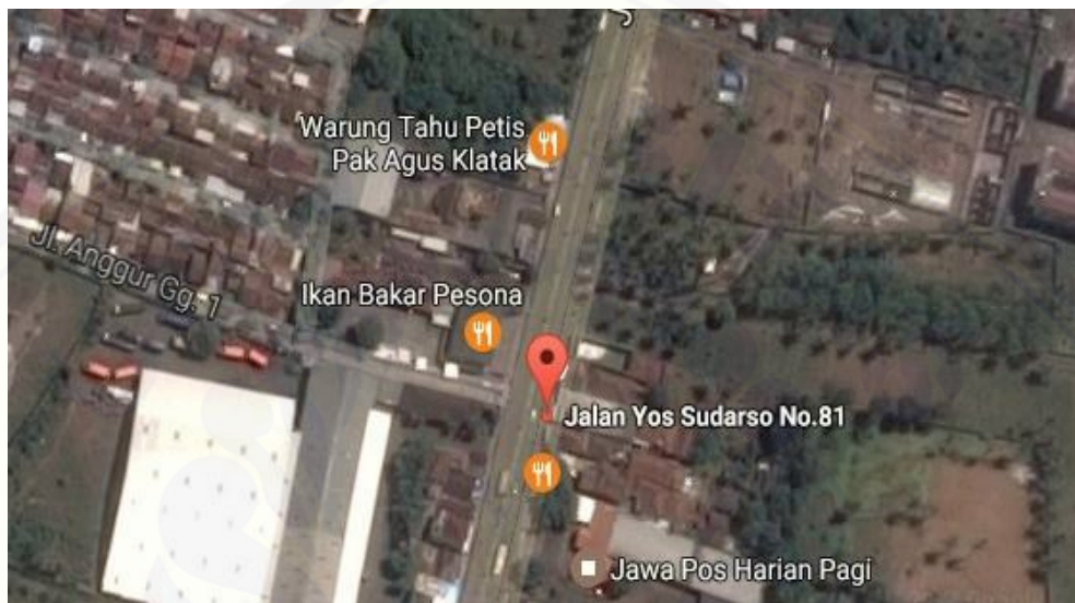
Gambar 3.1 Lokasi Proyek Hotel Illira Banyuwangi.

Lokasi penelitian dilakukan pada proyek pembangunan Hotel Illira Banyuwangi Jl. Yos Sudarso 81-83 Banyuwangi kecamatan Kalipuro. Waktu penelitian dimulai pada bulan Januari Tahun 2017.