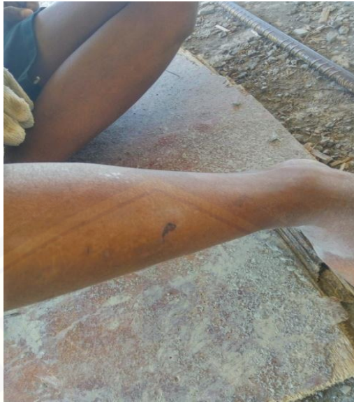
Kecelakaan kerja terkena material paku