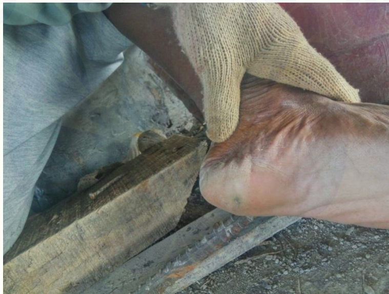
Kecelakaan kerja terkena material paku