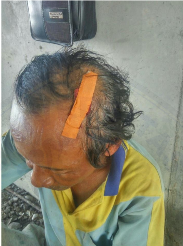
Kecelakaan kerja kejatuhan Polyfilm bekisiting