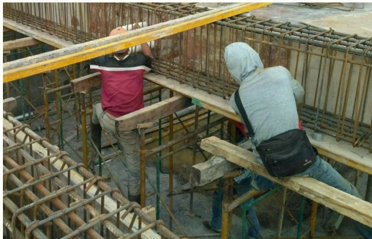
Pekerjaan bekisting balok