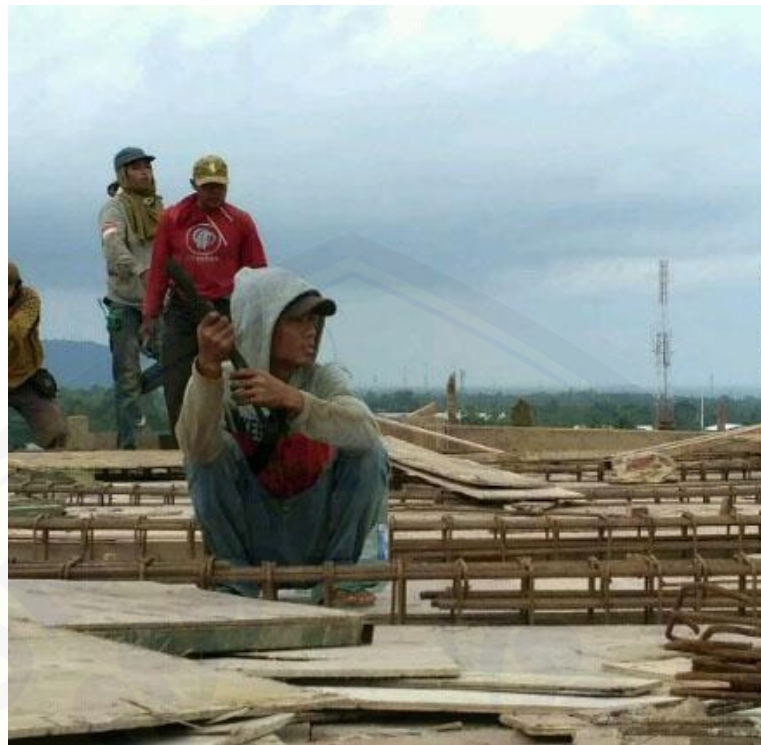
Pekerjaan bekisting plat