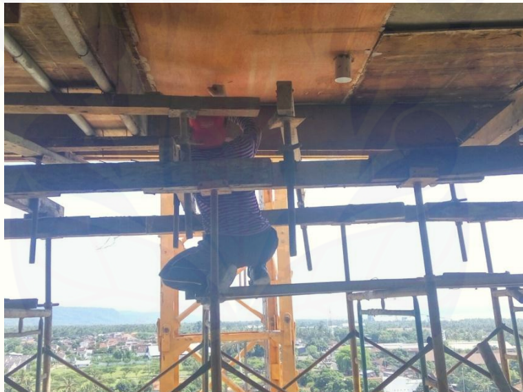
Pekerja yang tidak menggunakan APD