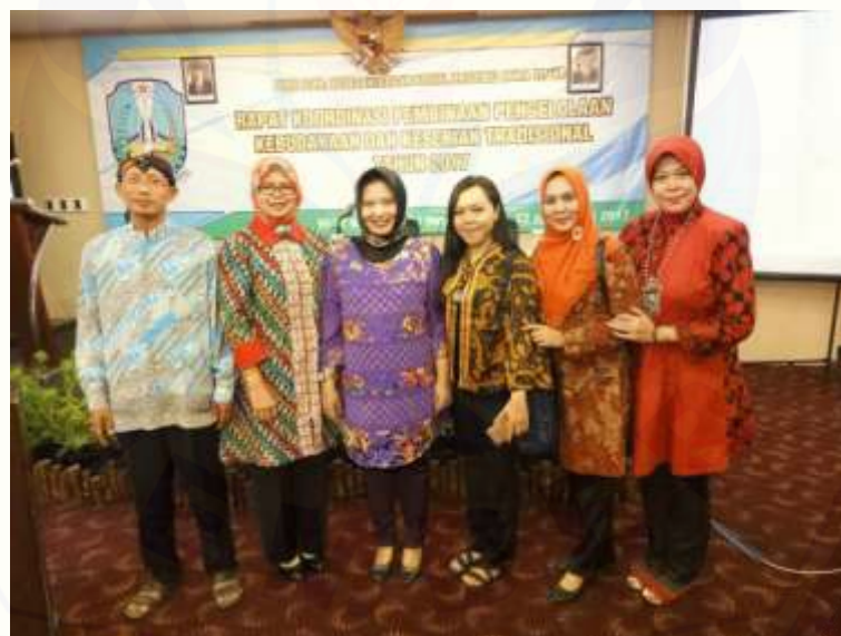
Foto Bersama Peserta Rapat Koordinasi Pembinaan Pengelolaan Kebudayaan dan Kesenian Tradisional

Menjadi narasumber pada Rapat Koordinasi Pembinaan Pengelolaan Kebudayaan dan Kesenian Tradisional yang diselenggarakan Biro Kesejahteraan Sosial Provinsi Jawa Timur di Malang, 22–24 Mei 2017