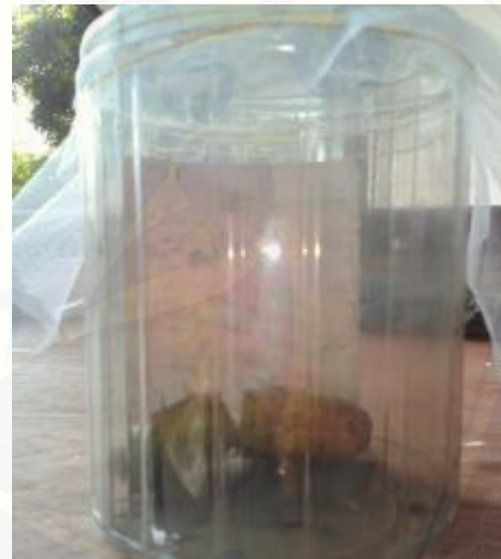
Percobaan rearing menggunakan pakan alternatif (mentimun)