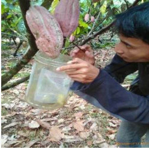
Penangkapan H. antonii di Lapang (1)