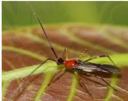
Gambar 2.1 Imago H. antonii (Atmadja, 2012)

Menurut Kalshoven (1981) dalam Wahyono (2005), H. antonii Sign. termasuk filum Arthropoda, kelas Insekta, ordo Hemiptera, famili Miridae, genus Helopeltis , spesies H. antonii . Hama ini merupakan hama yang paling dominan pada jambu mete dan kakao, karena paling cepat menimbulkan kerugian dan mempunyai kisaran tanaman inang yang sangat luas. H. antonii merupakan spesies yang paling banyak ditemukan di Indonesia dan mempunyai ciri-ciri bewarna coklat kehitaman, panjang tubuh 4,5-6,0 mm, pada bagian toraks terdapat tonjolan seperti jarum pentul, antenanya 4 ruas dan panjangnya dua kali panjang tubuhnya (Gambar 2.1) (Karmawati dan Mardiningsih, 2001).