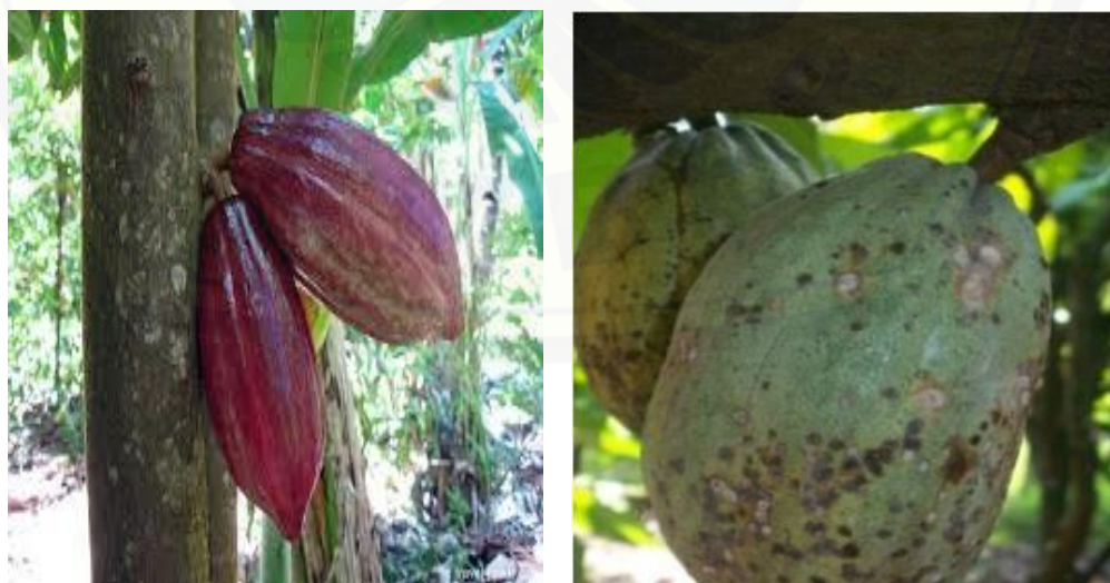
Gambar 2.2. Buah Kakao yang Sehat (kiri) dan Buah Kakao yang Terserang H. antonii (kanan) (Atmadja, 2012)

Ciri serangan adanya bercak-bercak hitam dan kering, pertumbuhan buah terhambat, buah kaku dan sangat keras serta jelek bentuknya dan buah kecil kering lalu mati (Darmawan, 2010). Serangan berat pada buah muda yang berukuran kurang dari 5 cm menyebabkan buah kering dan rontok (Soenaryo dan Situmorang, 1978). Pada serangan berat, seluruh permukaan buah akan banyak terdapat bekas tusukan berwarna hitam dan kering, kulitnya mengeras serta retak-retak (Gambar 2.2; Kanan) (Djamin, 1980). Daun yang terserang H. antonii terhambat pertumbuhannya dan menjadi kering. Serangan pada bunga menyebabkan kegagalan pembuahan. Buah yang terserang menunjukkan gejala bercak-bercak cokelat atau hitam yang akhirnya mengering dan gugur (Atmadja, 2003).