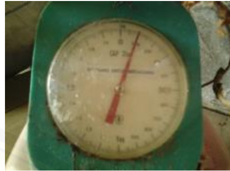
Penimbangan limbah tembakau