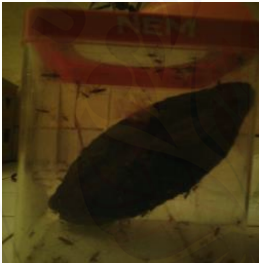
Hasil Tangkapan H. antonii di Lapang