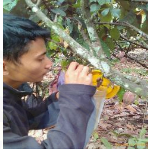
Penangkapan H. antonii di Lapang (2)