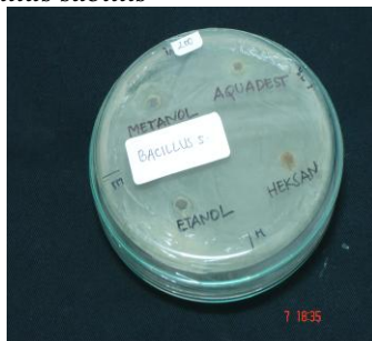
Gambar 7 dan 8. Penghambatan ekstrak benalu konsentrasi 100uL (7) dan 200uL (8) terhadap pertumbuhan Bacillus subtilis

Seperti halnya pada Staphylococcus aureus , pertumbuhan bakteri Bacillus subtilis juga bisa dihambat oleh ekstrak etanol dan metanol. Namun kemampuan penghambatan dari keduanya berbeda. Pada ekstrak etanol, diameter penghambatan adalah 22 mm (sangat kuat) dan 11 mm (kuat) untuk konsentrasi 100uL dan 200uL. Pada ekstrak metanol, pada konsentrasi 100uL dan 200uL mempunyai diameter penghambatan 16 mm (kuat) dan 9 mm (sedang). Kemampuan