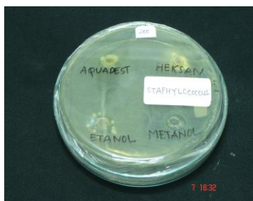
Gambar 5 dan 6. Penghambatan ekstrak benalu konsentrasi 100uL (5) dan 200uL (6) terhadap pertumbuhan Staphylococcus aureus

Konsentrasi ekstrak 100uL dan 200uL mempunyai diameter penghambatan yang berbeda, yaitu 10 mm (sedang) dan 12 mm (kuat). Besarnya diameter penghambatan pada kedua jenis ekstrak (etanol dan metanol) adalah sama untuk konsentrasi yang sama. Perbedaan konsentrasi penambahan ekstrak komponen antimikroba memang berpengaruh pada kemampuan antimikrobanya. Jeun An, et al.