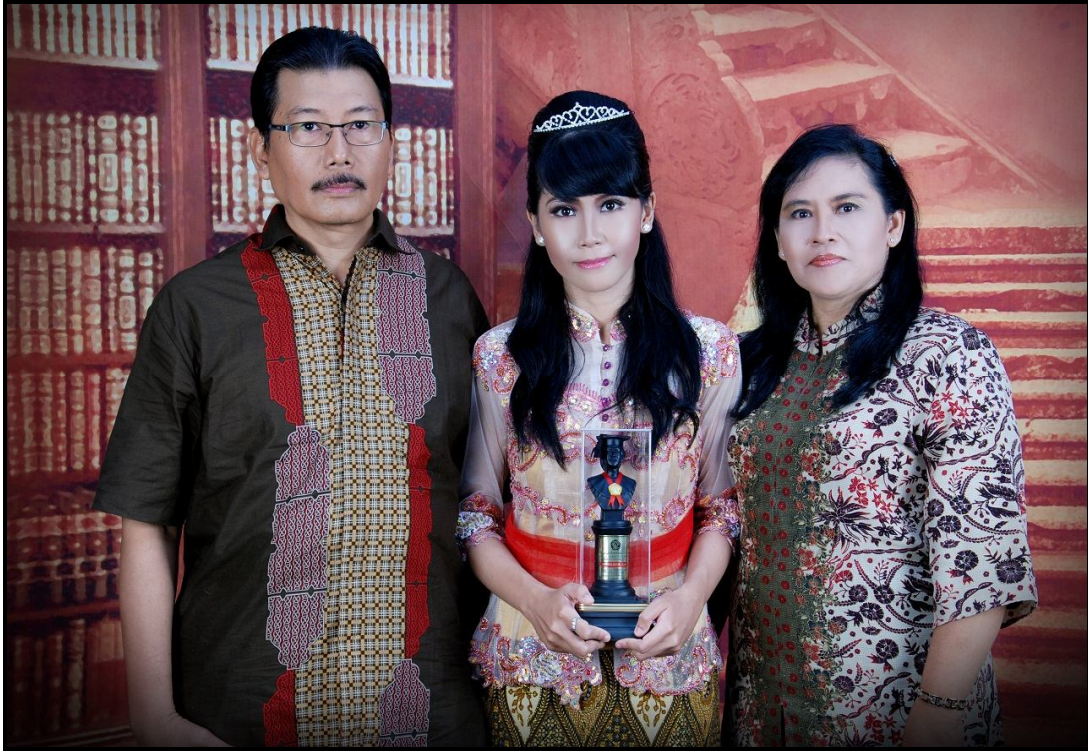
Gambar : Foto Tim Penulis Ayah-Bunda-Cita