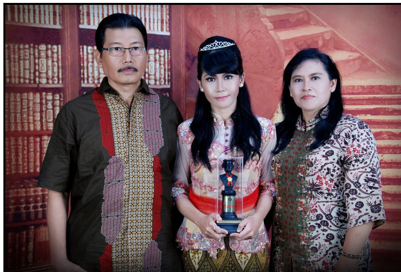
Gambar : Tim Penulis Ayah-Bunda-Cita

Blog : ayahbundacita.blogspot.com Email : ayahbundacita@gmail.com Email : nonacita@gmail.com