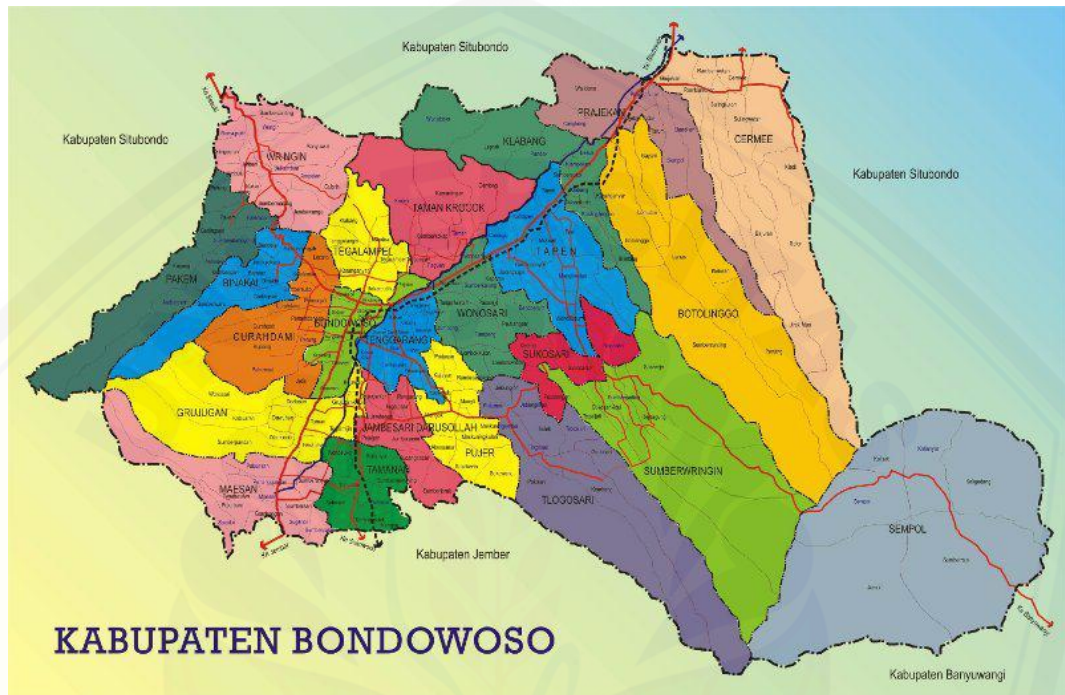
Gambar 1.1 Peta kabupaten Bondowoso