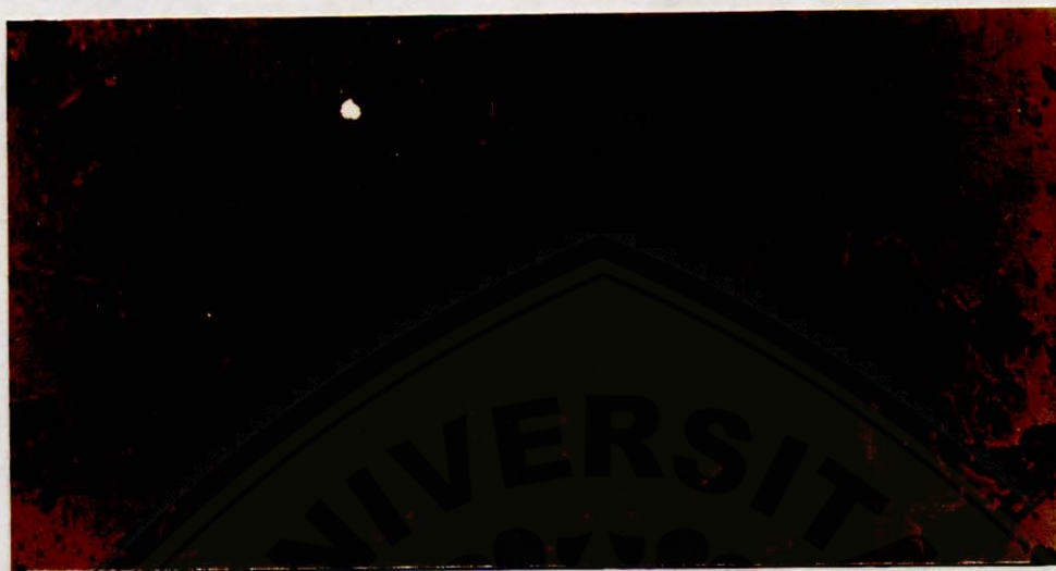
Lampiran 11. Bentuk Granula Makanan Bayi Formula Tepung Tempe