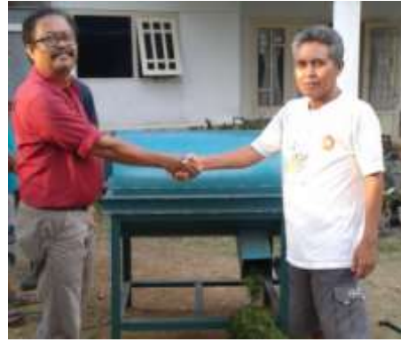
Gambar 1. Mesin penghancur sampah organik hasil rancangan.