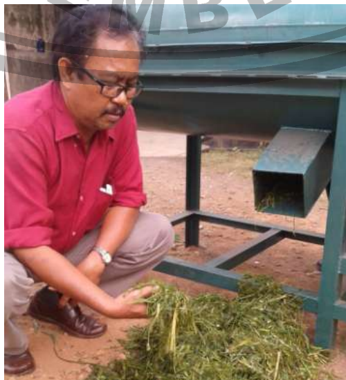
Gambar 2. Hasil pemotongan sampah organik

Jadi dalam setiap sekali proses, sampah yang tidak keluar 21,8\% atau sebesar 0,558 kg. Kapasitas mesin (Q) = 2,56 kg dalam 4,65 menit, jadi kapasitas yang diperoleh sebesar 70 kg/jam. Setelah dilakukan pengujian, besarnya kapasitas mesin sesuai dengan yang di harapkan.