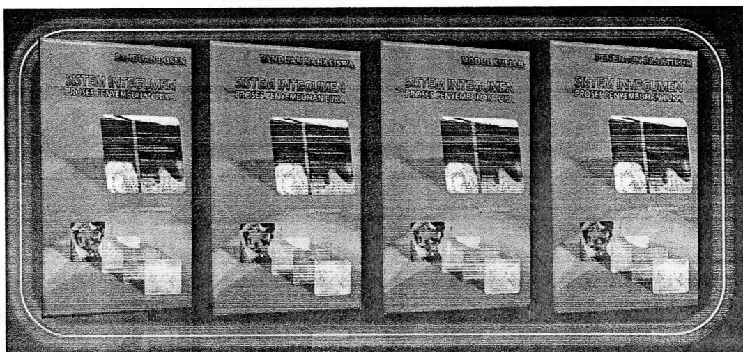
Gambar 1. Produk Pengembangan Bahan Ajar

Bahan ajar berupa modul dan petunjuk praktikum yang penyusunannya berdasarkan hasil penelitian tentang potensi getah jarak pagar pada proses penyembuhan luka yang digunakan untuk mahasiswa S1 pada matakuliah Fisiologi Hewan khususnya pokok bahasan system integumen. Modul yang dikembangkan melalui penelitian ini berupa bahan ajar yang disusun secara sistematis dengan mengikuti beberapa tahapan dalam model Dick & Carey (2005). Susunan modul terdiri dari komponen-komponen pembelajaran dengan urutan sebagai berikut. 1) judul bab, 2) standar kompetensi, 3) kompetensi dasar, 4) tujuan pembelajaran, 5) uraian materi, 6) rangkuman, 7) soal-soal latihan, 8) petunjuk penilaian pribadi, 9) link website . Modul ini juga dilengkapi dengan petunjuk praktikum sebagai bagian yang tidak terlepas dan saling melengkapi. Adapun hasil akhir pengembangan modul dan petunjuk praktikum dapat dilihat pada Gambar 1.