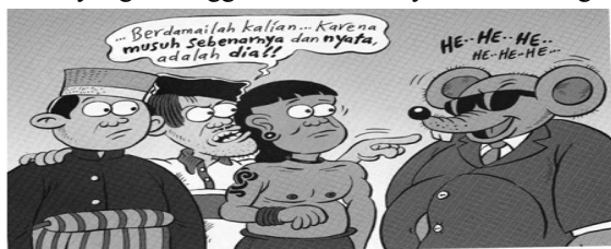
Suku Bugis dan Dayak Tumbang Torong bertolak belakang di Kota Tarakan, Kalimantan Timur. Masyarakat perlu diingatkan bahwa musuh yang nyata adalah korupsi.

Konteks: gambar empat tokoh kartun. Tokoh A seorang pria menggunakan pakaian adat Suku Bugis yang menggambarkan rakyat suku bugis.