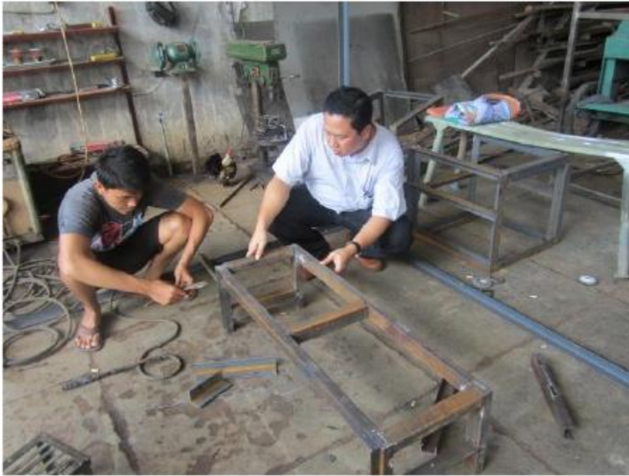
Proses perancangan Mesin Penggiling