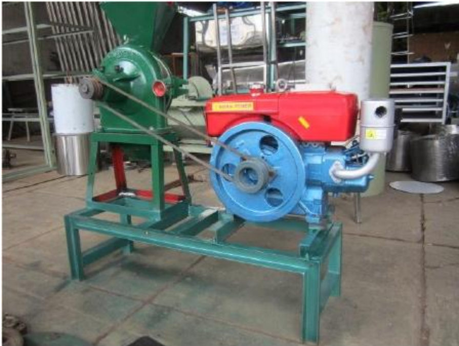
Mesin Penggiling Kompos Blok