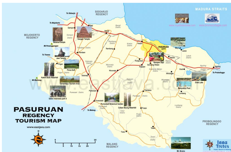
Gambar 2.2 Peta Wilayah Kota Pasuruan dan Kabupaten Pasuruan

Wilayah Kabupaten Probolinggo berjarak 180 km sedangkan Kabupaten Pasuruan berjarak 200 km dan Kota Pasuruan berjarak 225 km, selanjutnya adalah peta Kota Pasuruan dan Kabupaten Pasuruan seperti ditunjukkan gambar berikut: