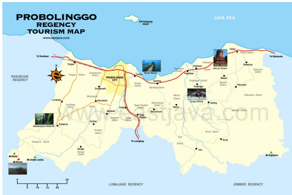
Gambar 2.1 Peta Wilayah Kabupaten Probolinggo

Wilayah Kabupaten Probolinggo berjarak 180 km sedangkan Kabupaten Pasuruan berjarak 200 km dan Kota Pasuruan berjarak 225 km, selanjutnya adalah peta Kota Pasuruan dan Kabupaten Pasuruan seperti ditunjukkan gambar berikut: