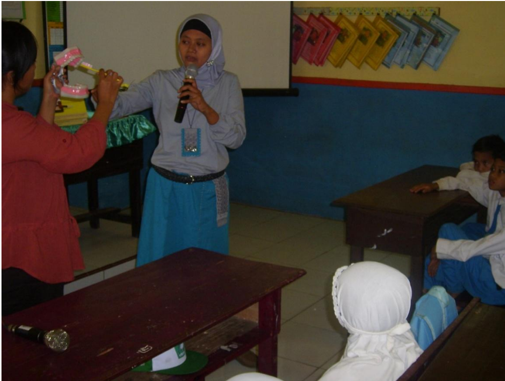
Penyuluhan di Pos I (MI Diponogoro)