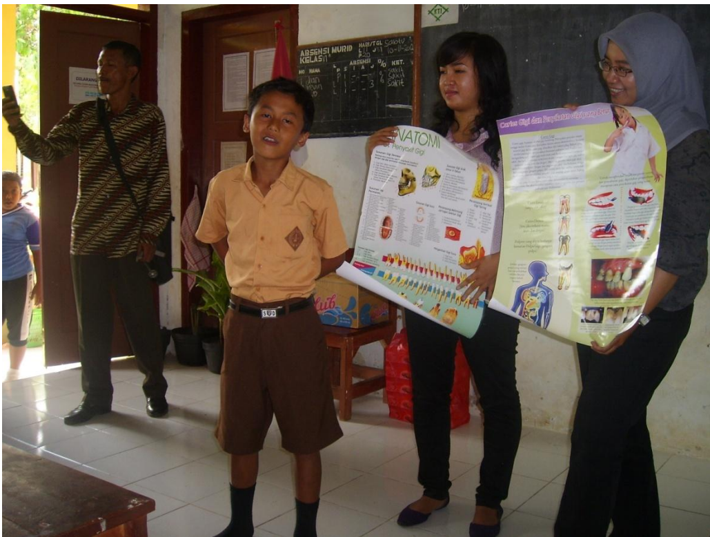
Pendampingan di Pos III (SDN Kemiri 1)