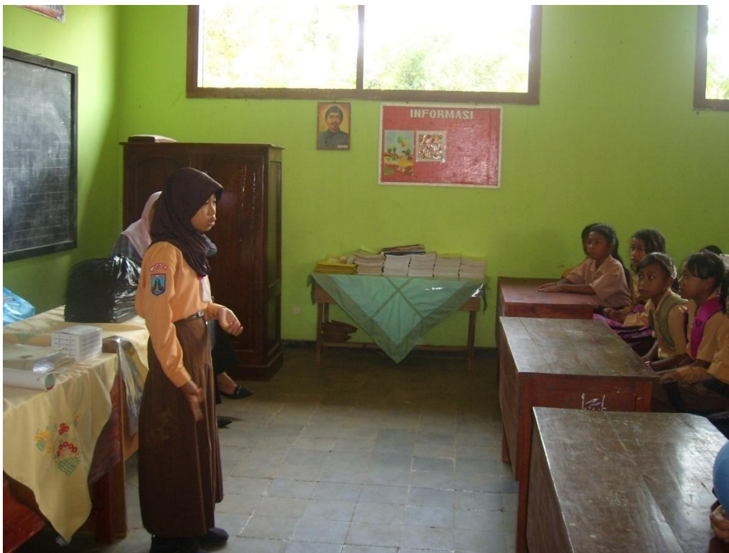
Pendampingan di Pos V (SDN Pakis 1)