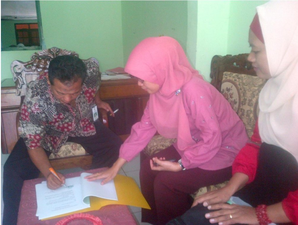
Koordinasi dengan Kepala Puskesmas Panti