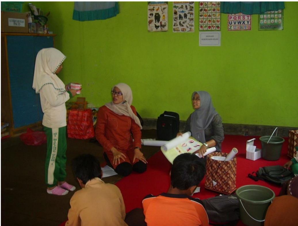
Pendampingan di Pos IV (MI Miftahul Ulum 2 Serut)