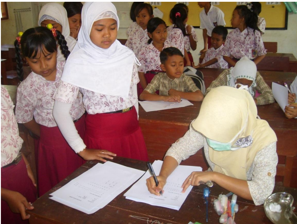
Pemeriksaan gigi di Pos II (SDN Suci 1)