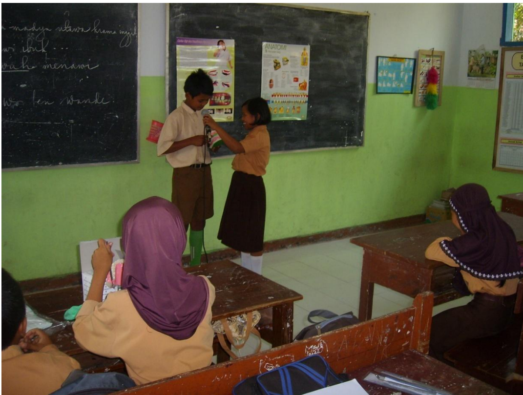
Pendampingan di Pos II (SDN Suci 1)