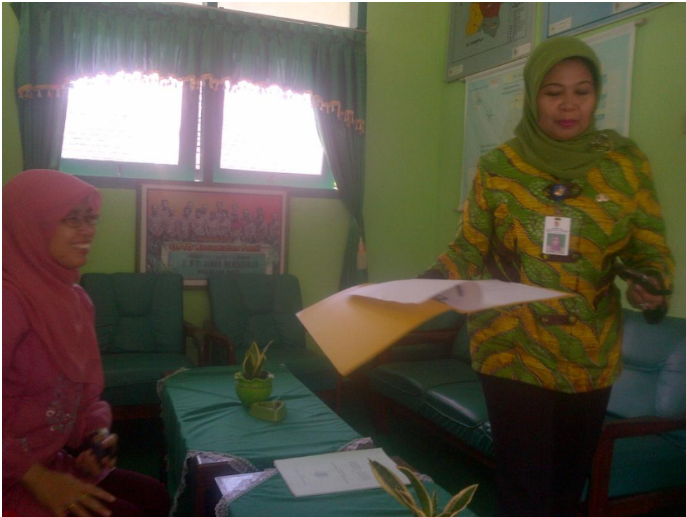
Koordinasi dengan Kepala UPT Dinas Pendidikan Kec. Panti