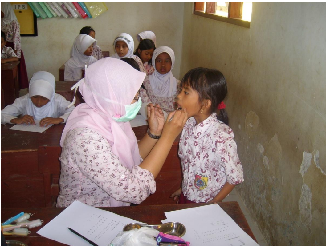
Pemeriksaan gigi di Pos III (SDN Kemiri 1)