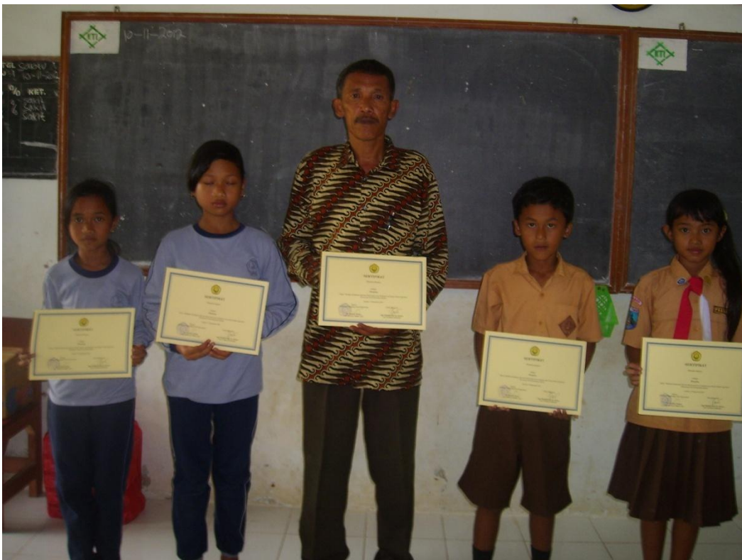
Pembagian Sertifikat di Pos III (SDN Kemiri 1)