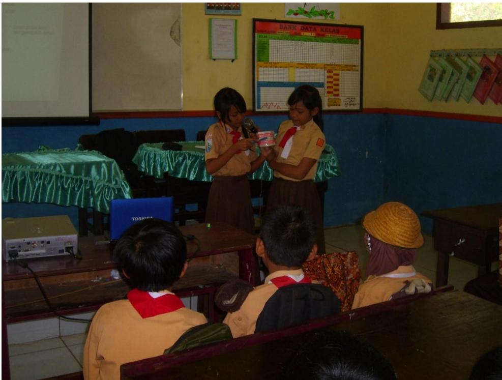
Pendampingan di Pos I (MI Diponogoro)