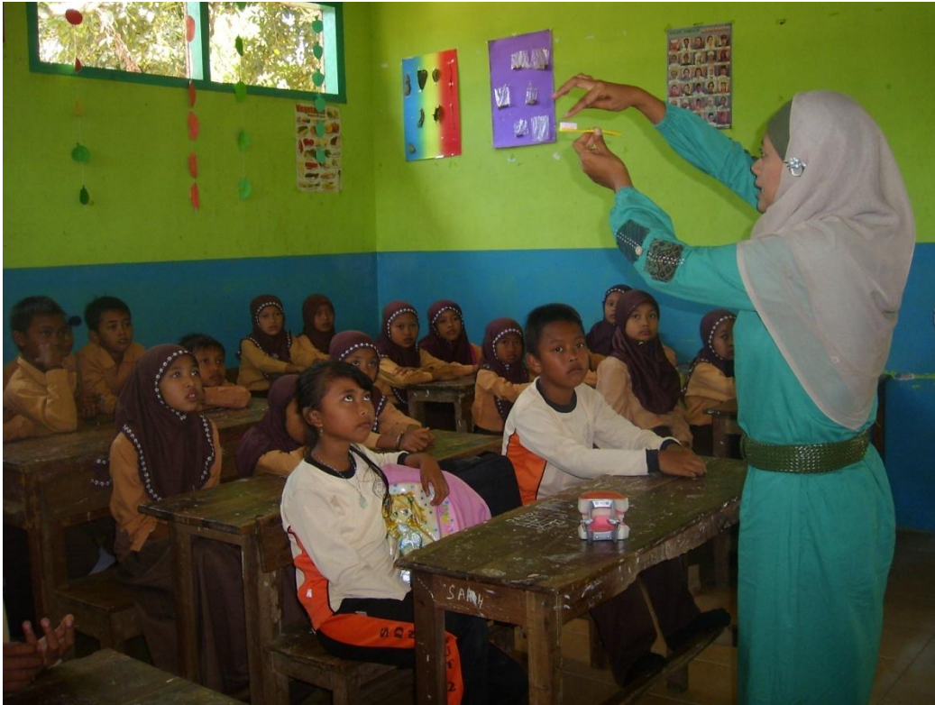
Penyuluhan di Pos IV (MI Miftahul Ulum 2 Serut)