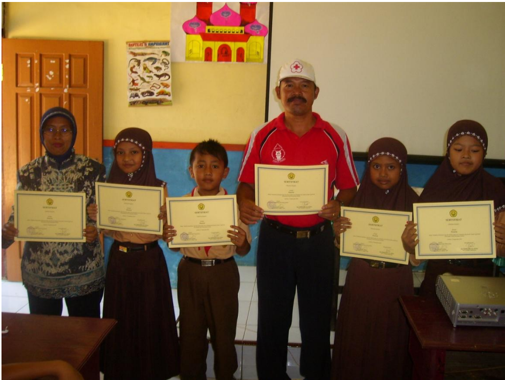
Pemberian Sertifikat di Pos I (MI Diponogoro)