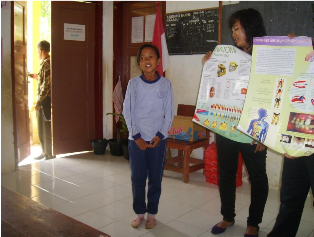
Pendampingan di Pos III (SDN Kemiri 1)