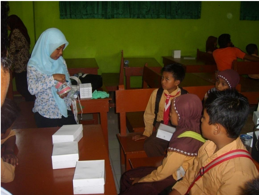
Pelatihan Guru Penjaskes dan Kader Dokter Gigi Kecil