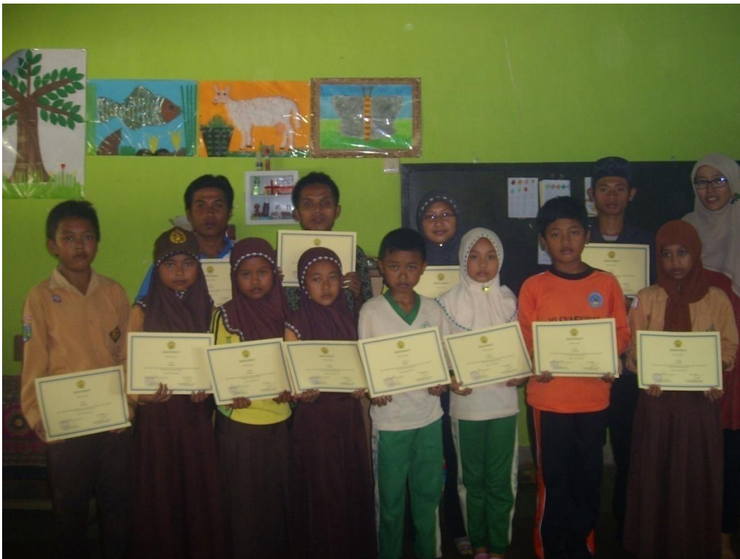
Pembagian Sertifikat di Pos IV (MI Miftahul Ulum 2 Serut)