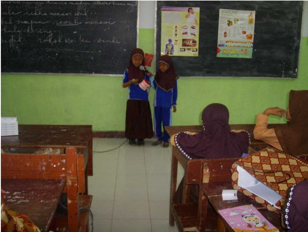
Pendampingan di Pos II (SDN Suci 1)