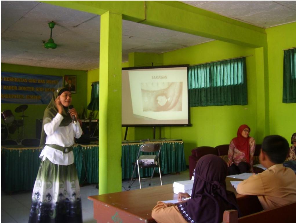
Pelatihan Guru Penjaskes dan Kader Dokter Gigi Kecil