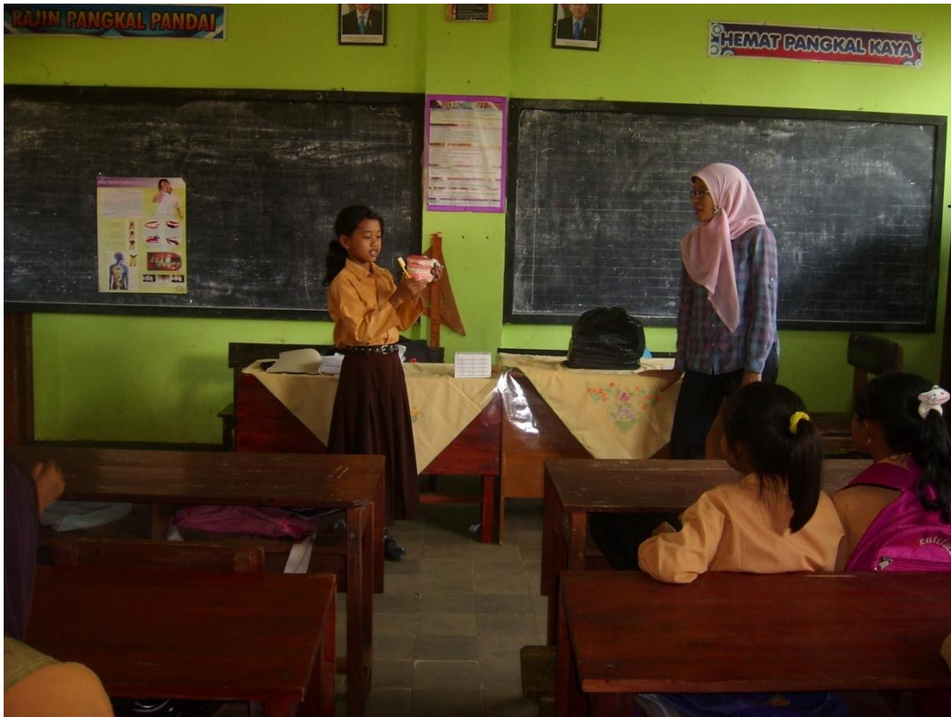
Pendampingan di Pos V (SDN Pakis 1)