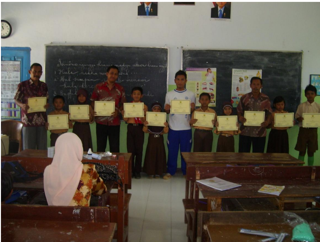
Pembagian Sertifikat di Pos II (SDN Suci 1)