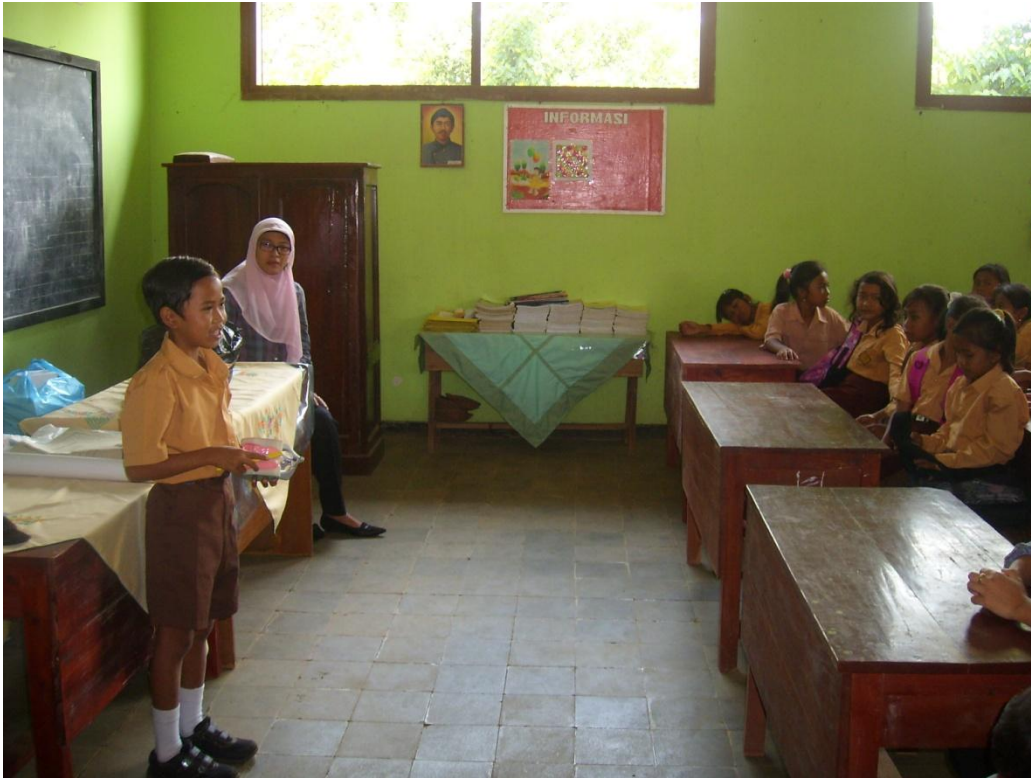
Pendampingan di Pos V (SDN Pakis 1)