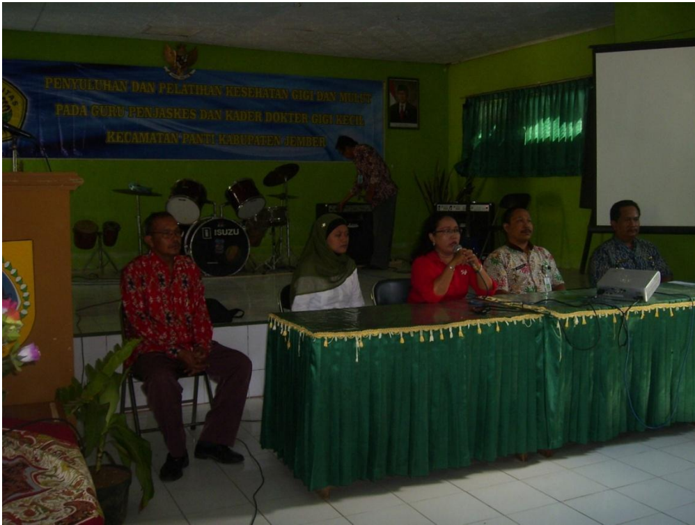
Penyuluhan Guru Penjaskes dan Kader Dokter Gigi Kecil