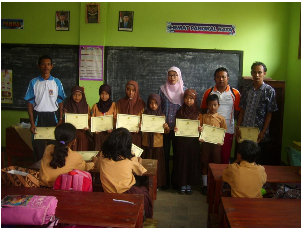
Pembagian Sertifikat di Pos V (SDN Pakis 1)