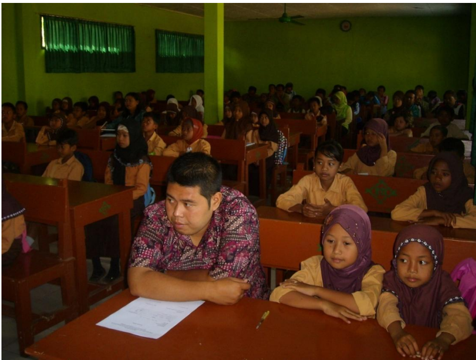
Penyuluhan Guru Penjaskes dan Kader Dokter Gigi Kecil