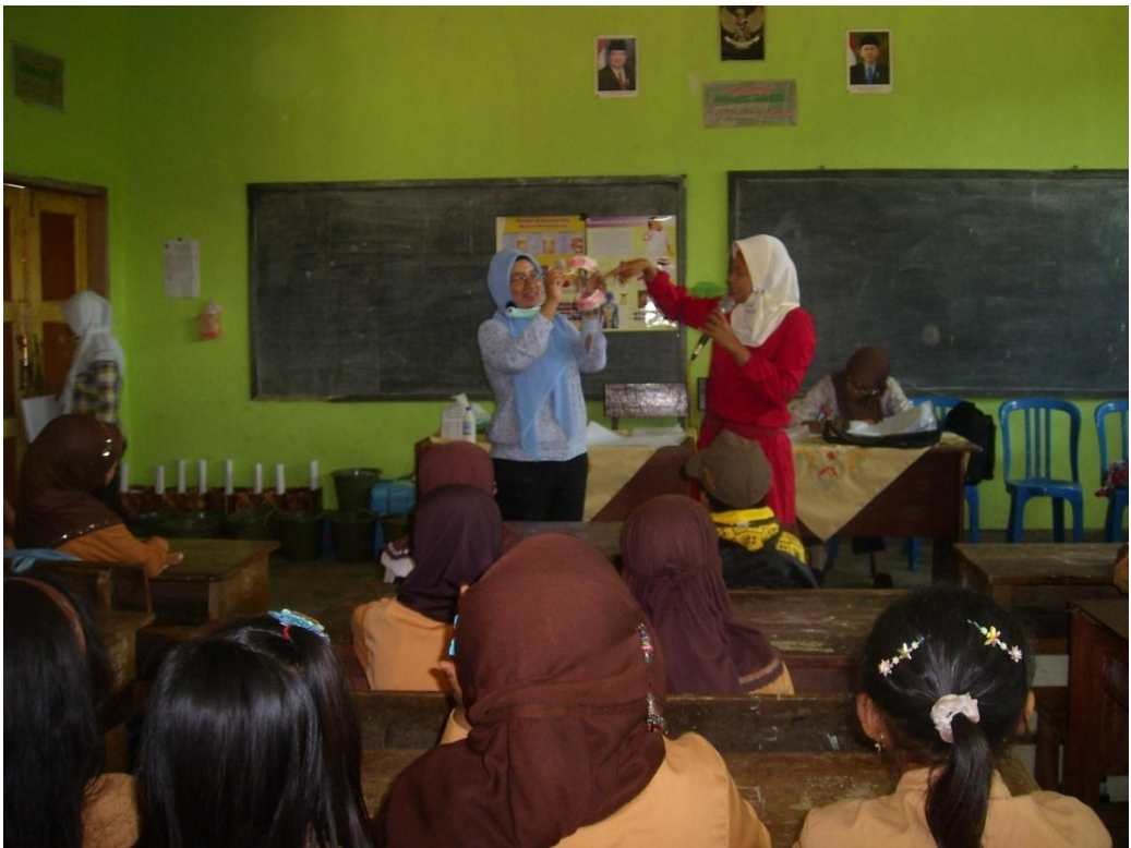
Penyuluhan di Pos V (SDN Pakis 1)