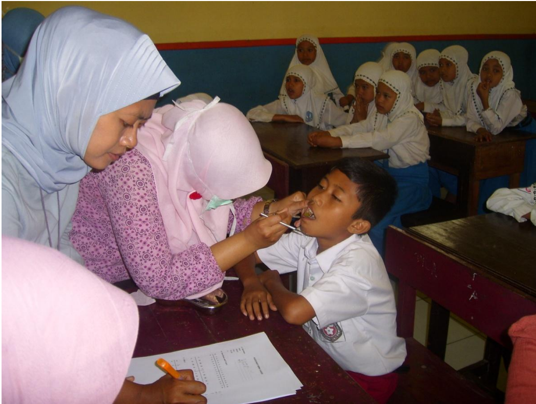
Pemeriksaan gigi di Pos I (MI Diponogoro)