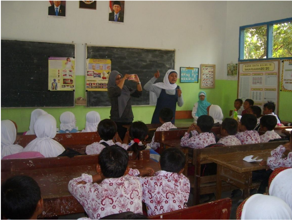
Penyuluhan di Pos II (SDN Suci 1)