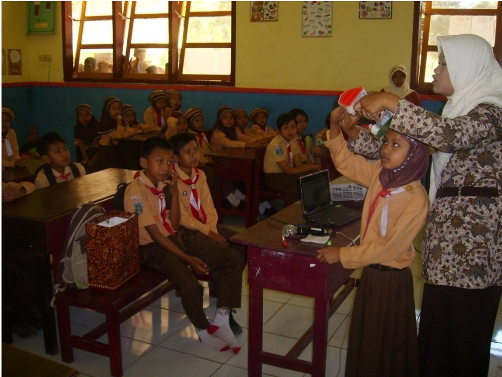
Pendampingan di Pos I (MI Diponogoro)