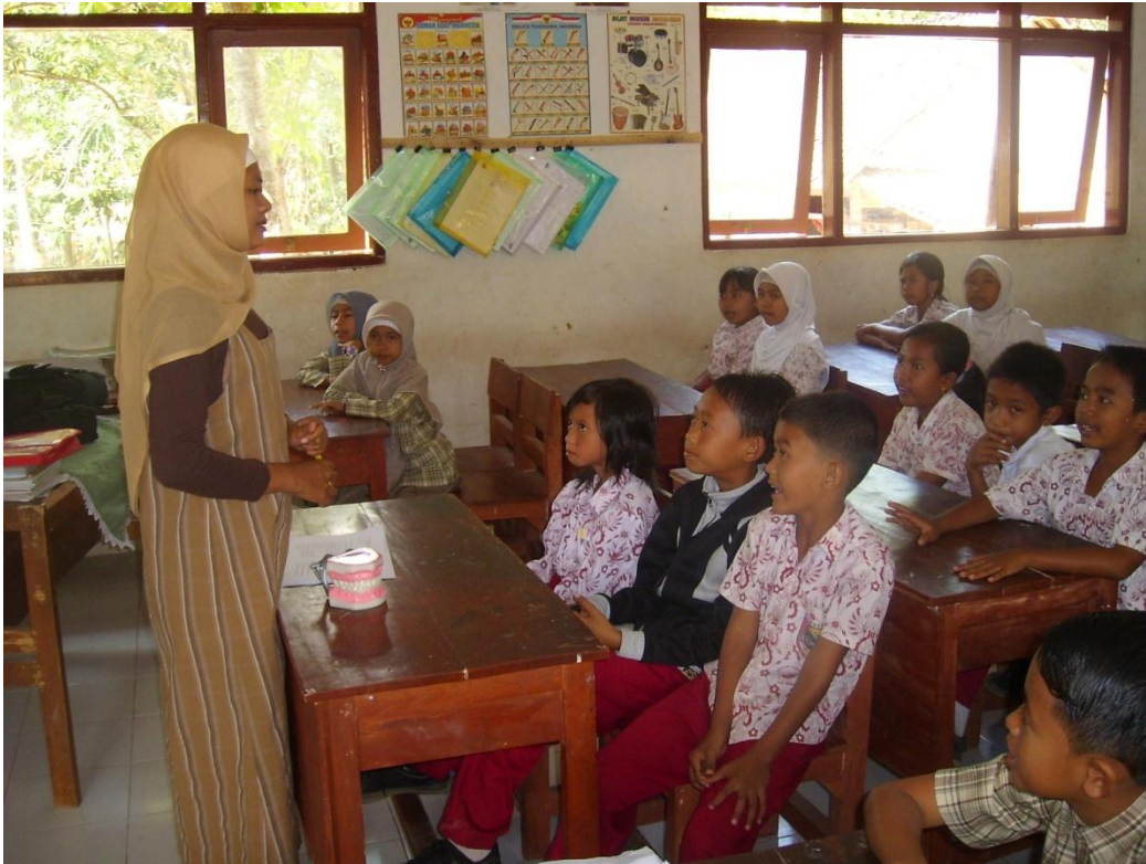
Penyuluhan di Pos III (SDN Kemiri 1)