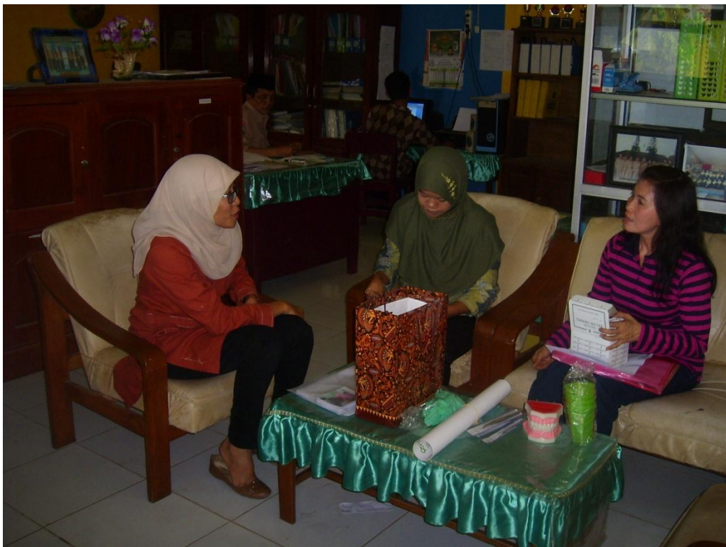
Monev Internal LPM Universitas Jember