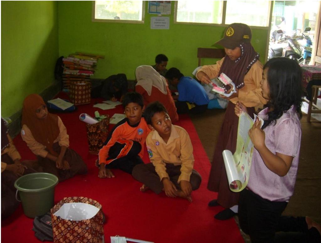
Pendampinga di Pos IV (MI Miftahul Ulum 2 Serut)