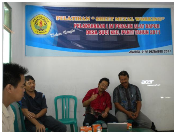
Gambar 4 : Pelatihan Sheet Metal Working Process

Pelatihan ini tidak hanya diikuti oleh pekerja mitra, tapi juga mengundang pekerja dilingkungan dusun Glundengan desa Suci sebanyak 15 orang selama 2 hari dengan rincian sehari tutorial dan sehari praktek. Materi yang disampaikan adalah proses pengerjaan lembaran logam, dan pengelolaan weblog.