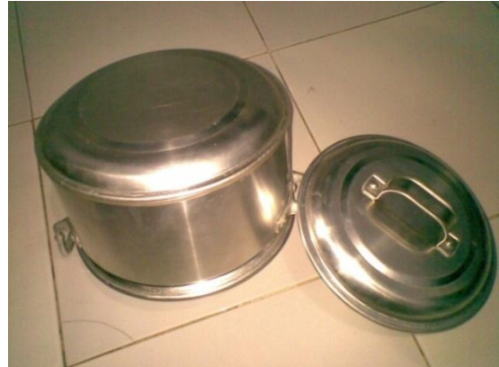
Hasil akhir produk setelah proses assembling