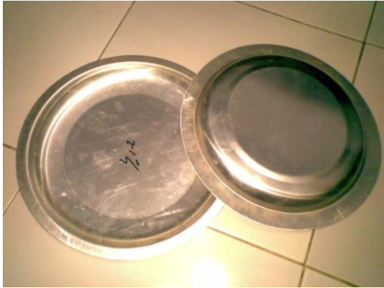
Komponen yang dibuat dengan mesin power press