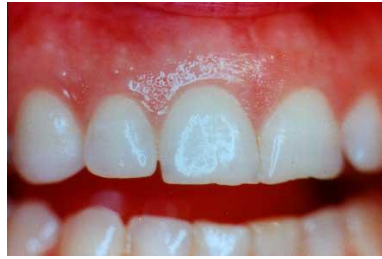
Gambar 2.2: Gingiva sehat (Anonim, 2011)

Gingiva mempunyai banyak suplai darah dari tiga sumber: pembuluh suprapariosteal dan pembuluh ligamen periodontal serta pembuluh alveolar yang keluar dari puncak tulang alveolar. Pembuluh-pembuluh ini saling bertautan pada gingiva untuk membentuk lingkaran kapiler pada papila jaringan gingiva antara rete peg epitelial. Drainase limfatik dimulai pada papila jaringan ikat dan berdrainase ke nodus limfa regional; dari gingiva mandibula ke nodus servikal, submandibular dan submental; dari gingiva maksila ke nodus limfa servikal bagian dalam (Manson dan Eley, 2004: 2).