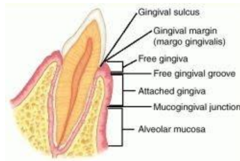
Gambar 2.1: Bagian-bagian gingiva (Anonim, 2011)

dari periosteum melalui perantara jaringan ikat longgar yang sangat vaskular. Jadi mukosa alveolar umumnya berwarna merah tua, berbeda dengan daerah gingiva cekat yang berwarna merah muda (Manson dan Eley, 2004: 2).