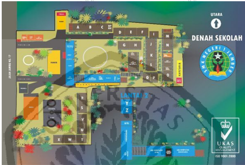
Sumber: SMK Negeri 1 Jember