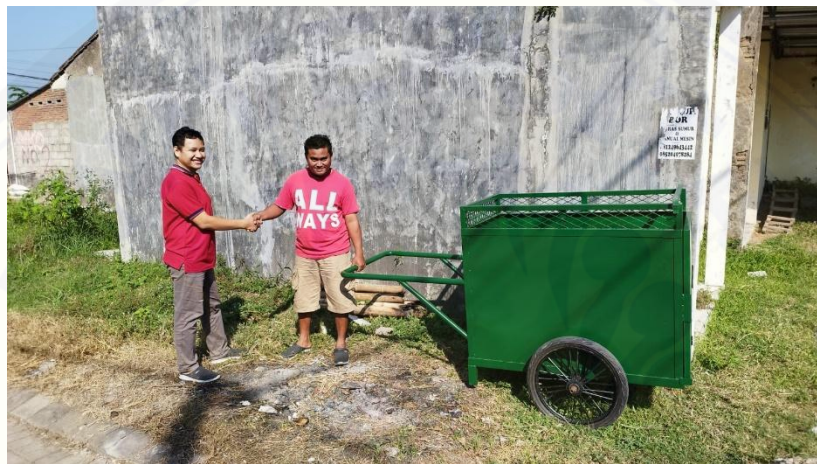
Gambar 4. Proses Pembuatan Gerobak Sampah dari Awal sampai Akhir