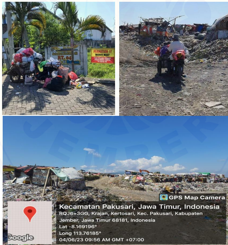
Gambar 3. Proses Pengangkutan Sampah Perumahan ke TPA Pakusari

Pengelolaan sampah secara mandiri dan produktif harus didukung dengan sarana dan prasarana yang layak dan baik. Contoh prasarana disini yakni TPA Pakusari, dan untuk sarana disini yakni gerobak sampah dan tempat sampah di setiap rumah. Gerobak sampah dinilai sangat penting karena berfungsi sebagai alat untuk proses pengangkutan sampah ke lokasi TPA Pakusari (Gambar 3). Bukti hasil pengabdian mandiri yang telah dilakukan di perumahan Mojopahit Sweet Home yakni pembuatan gerobak sampah. Proses pembuatan gerobak sampah dari awal sampai akhir dapat dilihat pada Gambar 4.