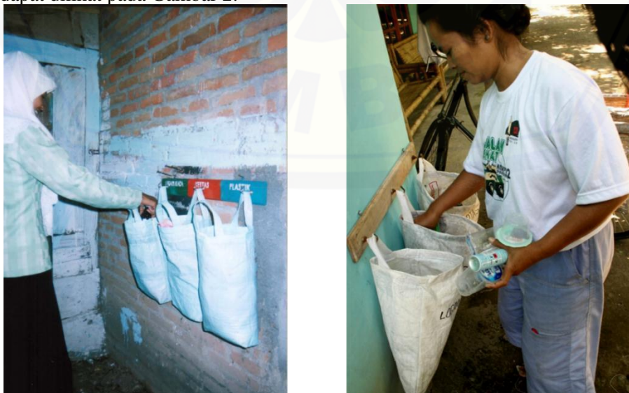
Gambar 1. Proses Pemilahan Sampah Berdasarkan Jenisnya

Pemilahan sampah merupakan tahap awal yang harus bisa dilakukan dalam pengolahan sampah yang berwawasan lingkungan berkelanjutan. Pemilahan sampah dapat dilakukan dengan mengkategorikannya berdasarkan jenis (sampah organik dan non organik) dan kegunaannya (sampah yang laku jual, sampah yang dapat diolah, sampah tidak laku jual dan tidak dapat diolah). Hasil pemilahan sampah berdasarkan jenis dapat dilihat di Gambar 1. Proses pemilahan berdasarkan kegunaannya dapat dilihat pada Gambar 2.