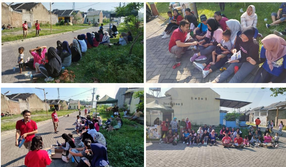
Gambar 5. Sosialisasi Pengelolaan Sampah secara Mandiri dan Produktif

Proses pemilahan sampah akan lebih efisien bila sarana dilokasi dinilai layak dan berfungsi dengan baik. Contoh hasil bentuk pengelolaan sampah yang dapat bernilai jual yakni pembuatan ekobrik. Sosialisasi pembuatan ekobrik secara umum di Perumahan Mojopahit Sweet Home