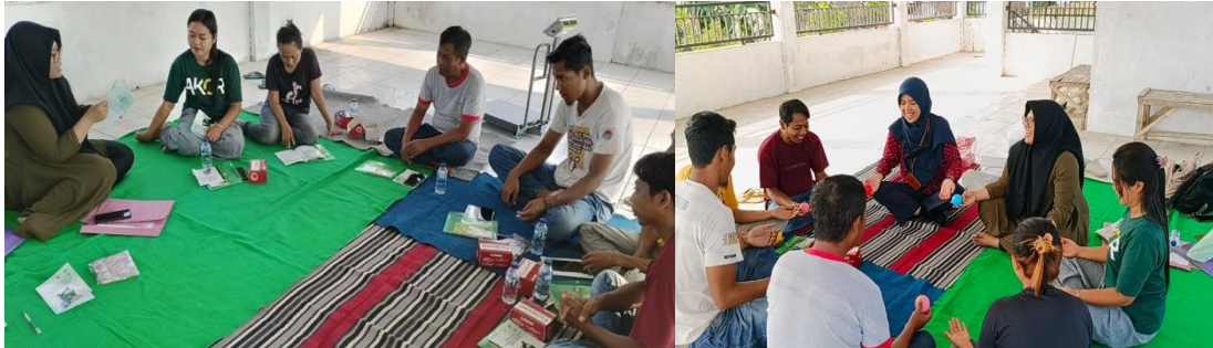
Gambar 5. Penyampaian materi dan simulasi sistem bank sampah

Kegiatan “Pelatihan Teknis Optimalisasi Sistem Bank Sampah Wilayah Pesisir” ini diawali dengan pretest sebagai bentuk penilaian awal sasaran sebelum penyampaian materi. Penyampaian materi pelatihan dilakukan oleh tim ahli Kesehatan Lingkungan dari Fakultas Kesehatan Masyarakat Universitas Jember (Gambar 5). Hasil pretest menunjukkan bahwa pengetahuan peserta tentang jenis bank sampah, jenis sampah, unsur tata kelola bank sampah, dan tahapan proses manajemen bank sampah termasuk dalam kategori kurang. Hasil ini diperoleh dari perhitungan skor keseluruhan peserta yang dikategorikan menjadi tiga, yaitu kurang (0—14), cukup (> 14—28), dan baik (>28—42).