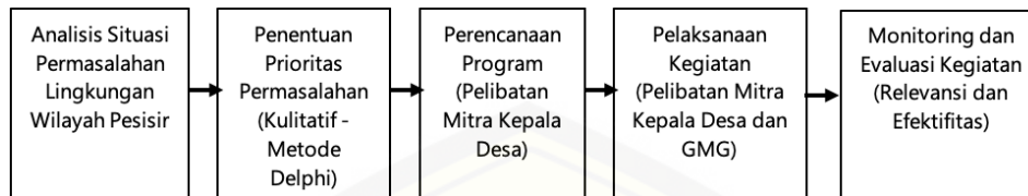
Gambar 3. Alur kegiatan pemberdayaan masyarakat

keterangan terlebih dahulu definisi, prinsip dan konsep materi sistem bank sampah dan dilanjutkan dengan diskusi tanya jawab bersama peserta (Nurhaliza, dkk., 2021). Metode brainstorming dilakukan setelah metode ceramah selesai dengan tujuan untuk meningkatkan peran peserta secara aktif dalam menyampaikan pendapat dan ide dalam optimalisasi sistem bank sampah di Desa Puger Kulon (Suparman, dkk., 2019). Metode simulasi merupakan metode terakhir yang dilakukan dalam kegiatan pelatihan teknis ini dengan tujuan untuk mengembangkan pemahaman dan penghayatan terhadap pelaksanaan sistem bank sampah yang lebih banyak mengarah kepada psikomotor peserta (Hasbullah, 2021). Media pembelajaran yang digunakan adalah modul Panduan Praktis Penerapan Sistem Manajemen Bank Sampah dalam empat bahasa (bahasa Indonesia, Inggris, Jawa, dan Madura) (Gambar 4).