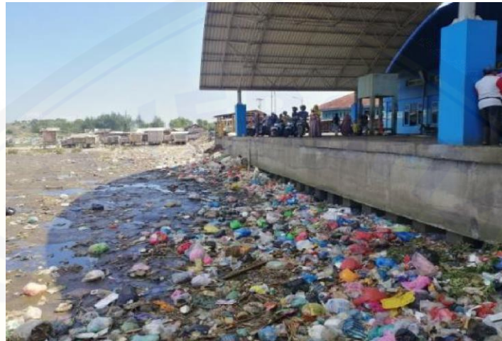
Gambar 1. Kondisi timbulan sampah di kawasan pesisir Desa Puger Kulon, Jember

secara mandiri. Kendala pada aspek teknis seperti sarana prasarana serta aspek peran serta masyarakat seperti minimnya pengetahuan dan keterampilan dalam penerapan sistem bank sampah yang berkelanjutan, membuat upaya yang dilakukan tersebut tidak berjalan. Kegiatan pemberdayaan penerapan sistem bank sampah dapat menjadi solusi untuk meningkatkan pengetahuan, sikap hingga keterampilan kelompok masyarakat (Cahyono & Budi, 2021). Hasil penelitian tahun 2020 juga menunjukkan bahwa fungsi manajemen yang terdiri dari planning, organizing, actuating dan controlling sangat diperlukan untuk keberlanjutan kegiatan pengelolaan sampah melalui sistem bank sampah (Santi, 2020). Berdasarkan modal SDM yang telah dimiliki oleh Desa Puger Kulon, yaitu karang taruna GMG, penting dilakukan pemberdayaan masyarakat sebagai upaya optimalisasi sistem bank sampah untuk mengelola sampah di wilayah pesisir melalui pelatihan teknis pengelola bank sampah yang dimiliki oleh GMG. Kegiatan pemberdayaan masyarakat ini berupa pelatihan teknis kepada karang taruna GMG dengan tujuan untuk meningkatkan pengetahuan dan keterampilan karang taruna GMG dalam melakukan pengelolaan sampah dengan optimalisasi sistem bank sampah di wilayah pesisir.