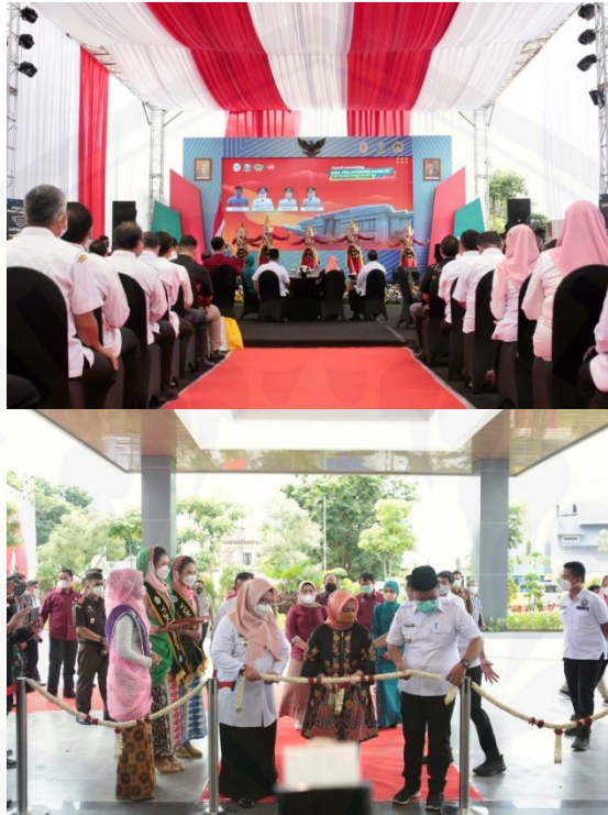
Gambar 2: Kegiatan Grand Launching Mal Pelayanan Publik sedang Berlangsung

Sepanjang acara panitia saling bekerja sama menyelesaikan tanggung jawabnya, saling menutupi kekurangan jika terdapat pekerjaan yang belum baik pengerjaannya. Tidak ada satupun panitia yang terlihat santai, semuanya menjalankan tugasnya secara serius. Hal inilah yang membuat CV. Imagine Promosindo dapat bersaing dengan event organizer yang lain. Berkat sikap tanggap, disiplin dan detail penyelenggaraan setiap event mampu berjalan dengan sangat baik, tidak mengecewakan konsumen.