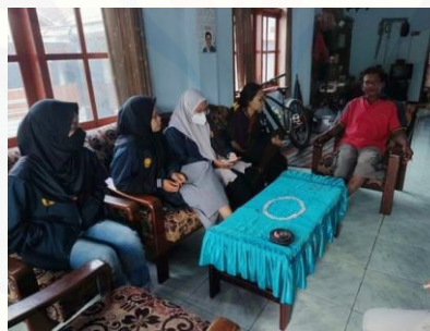
gambar 2. Wawancara bersama petani tembakau untuk menggalai permasalahan

Primadona tanaman unggulan di Desa Mojo adalah Tembakau atau dikenal sebagai tembakau Mojo, eksistensi tembakau mojo sudah dikenal hingga masyarakat di luar Desa Mojo. Rasa tembakau Mojo yang khas membuat kebutuhan pasar tembakau Mojo cepat tinggi, banyak konsumen yang berdatangan ke rumah petani-petani tembakau Mojo untuk mencari tembakau Mojo. Akan tetapi tingginya minat konsumen berbanding terbalik dengan ketersediaan tembakau Mojo, hal ini dikarenakan banyak lahan petani yang terserang hama dan penyakit tanaman. Para petani terjadi penurunan produksi hingga gagal panen diakibatkan serangan hama dan penyakit tanaman tembakau.