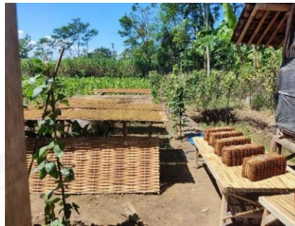
gambar 1. Potensi Tembakau desa Mojo 15

yang diusung oleh kelompok kkn 448 meliputi: penyuluhan hama dan penyakit tanaman tembakau, membuat e-book, dan membuat asosiasi petani tembakau sebagai upaya awal meningkatkan produktivitas tembakau Mojo.