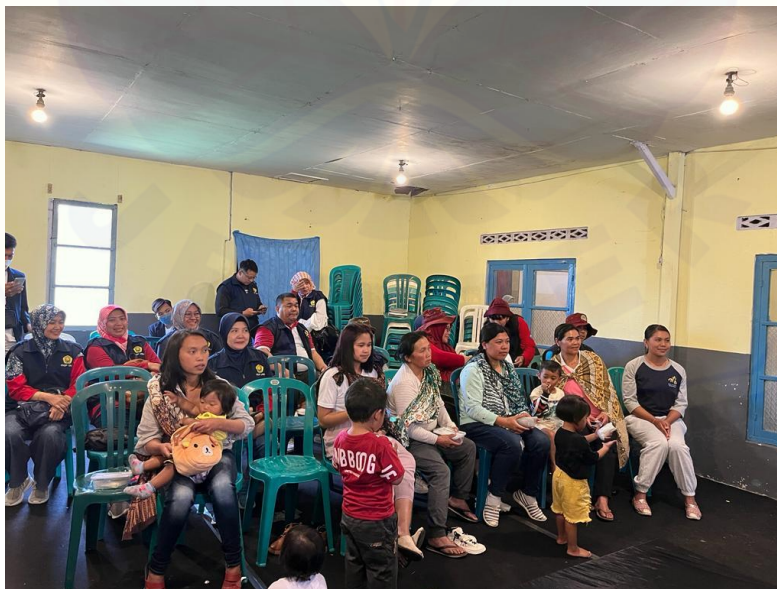
Gambar 1. situasi saat pemberian edukasi

Ibu-ibu mendapatkan pengalaman dan ilmu yang akan diterapkan saat merawat balita mereka. Selain itu ibu-ibu juga memperoleh pengalaman nyata yaitu telah belajar bersama membuat racikan jahe madu mulai dari memahami komponen utama dan kandungan dari jahe dan madu, menyiapkan bahan, dan proses pembuatannya. Pelaksanaan kegiatan ini sesuai dengan Permensos nomor 10 Tahun 2014 dalam pasal 1 menyatakan bahwa penyuluhan sosial adalah suatu proses pengubahan perilaku yang dilakukan melalui penyebaran informasi, komunikasi, motivasi dan edukasi baik secara lisan maupun tulisan untuk memperoleh pemahaman yang sama, pengetahuan dan kemauan guna berpartisipasi secara aktif dalam penyelenggaraan kesejahteraan sosial. Metode demonstrasi sekaligus mempraktekkan pembuatan racikan jahe madu sangat efektif, karena peserta akan langsung menerapkan hasil belajarnya ke hal nyata, sehingga ini akan mudah untuk diingat dan di tiru kembali oleh peserta. Ibu-ibu akan mencoba kembali ilmu yang sudah didapat pada keluarga masing-masing bahkan dapat menjadi sumber informasi untuk masyarakat di sekitarnya. Pemberian edukasi dan mempraktekkan suatu hal akan mempercepat daya serap dan ingat seseorang Berikut dokumentasi kegiatan pengabdian masyarakat yang dilakukan di Desa Wonotoro Kecamatan Sukapura: