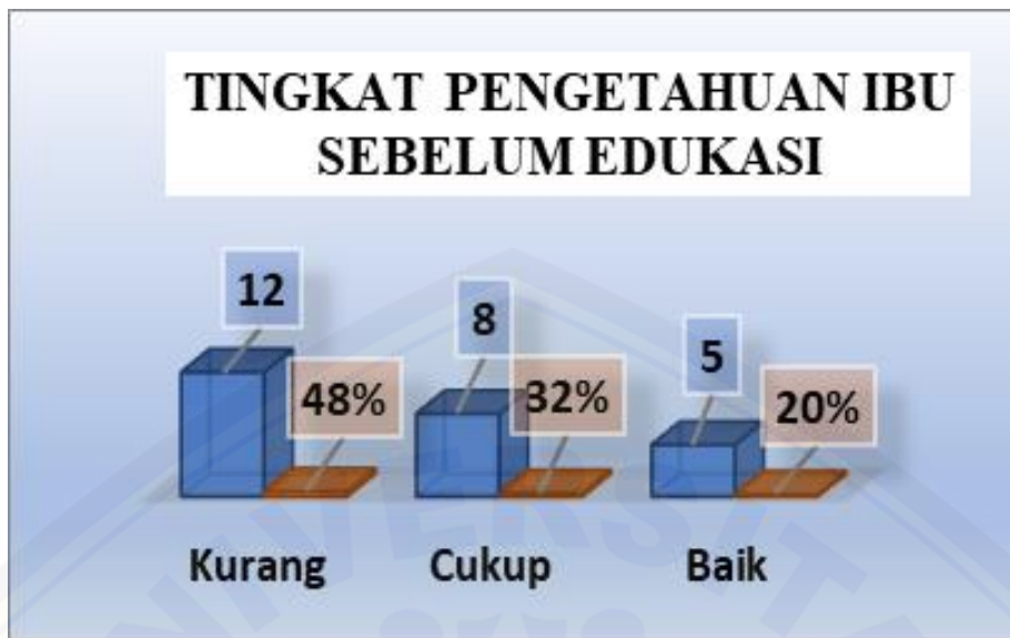
Diagram 1. Distribusi frekuensi ibu-ibu peserta sebelum dilakukan edukasi pemanfaatan tanaman obat (jahe) sebagai terapi komplementer Infeksi Saluran Pernafasan Akut (ISPA) pada balita di desa Wonotoro

Diagram 1 menunjukkan hasil pra survey sebelum kegiatan ini dilakukan, di dapatkan pengetahuan ibu – ibu peserta tentang pemanfaatan tanaman obat keluarga (jahe) sebagai terapi komplementer ISPA pada balita adalah hampir setengahnya (48%) mempunyai pengetahuan kurang, sebagian kecil pengetahuan cukup (32%) dan sebagian kecil lagi berpengetahuan baik (20%)