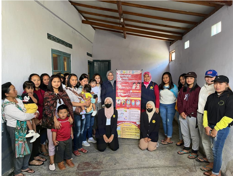
Gambar 2. foto Bersama