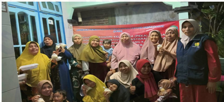
Gambar 5. Pelatihan Peningkatan Soft Skill Pembuatan Sari Kedelai