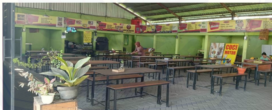
Gambar 9. Fasilitas Pemasaran