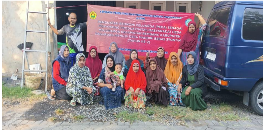
Gambar 4. Kegiatan Pelatihan Soft Skill Pembuatan Tempe