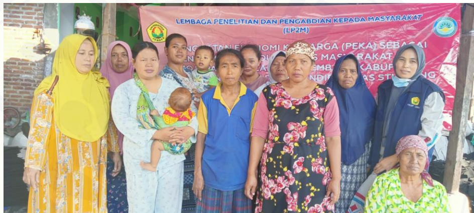
Gambar 8. Pelatihan Peningkatan Soft Skill Kerajinan Keset