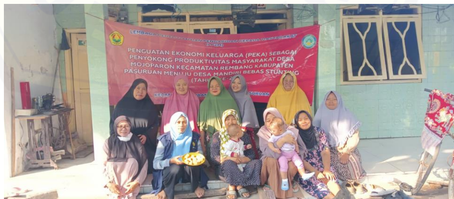
Gambar 3. Pelatihan Pembuatan Nugget Lele