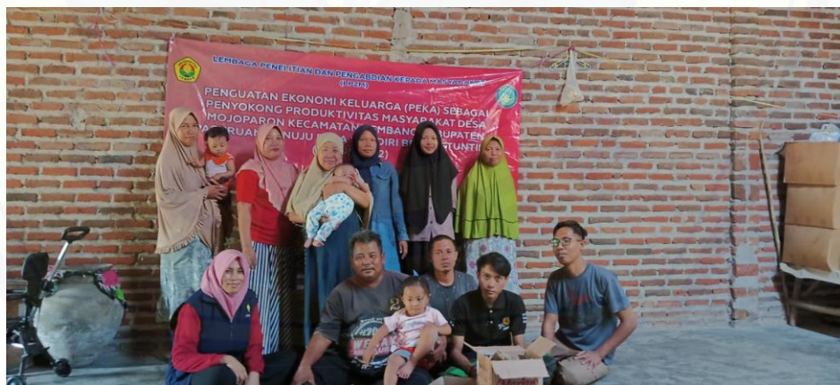
Gambar 6. Pelatihan Peningkatan Soft Skill Kerajinan Topeng