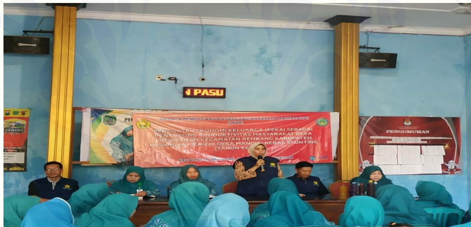
Gambar 2. Kegiatan Koordinasi Program Soft Skill

Berikut beberapa dokumen kegiatan pengabdian kepada masyarakat melalui program hibah desa binaan tahun ke-2 Universitas Jember di Desa Mojoparon-Rembang-Kabupaten Pasuruan