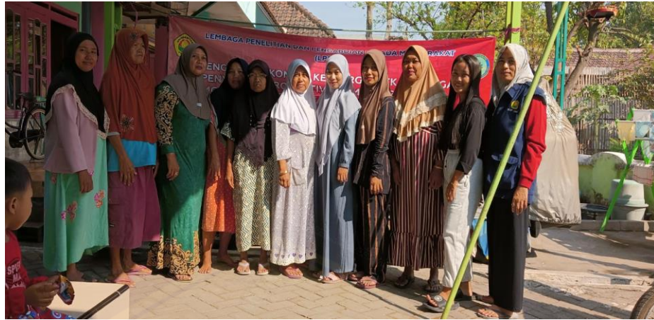
Gambar 7. Pelatihan Peningkatan Soft Skill Pembuatan Krupuk Kulit Lele