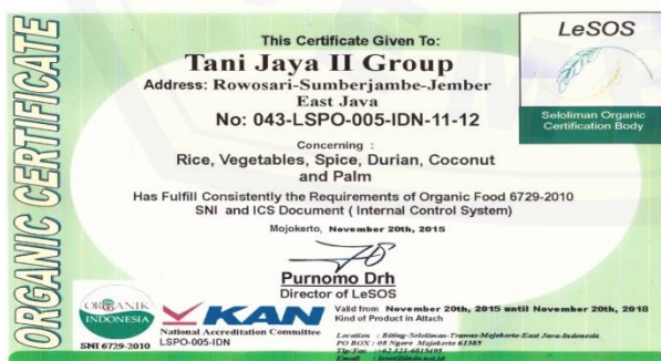
a) Sertifikat organik Kelompok Tani “Tani Jaya II”

Hasil yang dirasakan oleh kelompok tani “Tani Jaya II” setelah memperoleh perpanjangan sertifikasi yaitu masih adanya sertifikat dan logo organik dalam setiap produk (beras organik), sehingga dapat meningkatkan kepercayaan konsumen. Manfaat lainnya yaitu memudahkan dalam hal pemasaran, karena produsen percaya bahwa produk yang dihasilkan kelompok tani telah tersertifikasi organik. Kelompok tani juga memperoleh pembinaan dari pihak LeSOS, sehingga dapat konsisten dalam menerapkan usahatani padi organik. Output yang dicapai oleh kelompok tani “Tani Jaya II” berupa produk organik yang berhak memperoleh logo organik yang terdiri dari beras putih, beras merah, dan beras hitam.