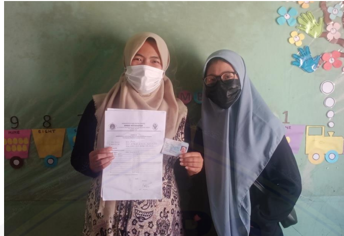
Gambar 10. Proses penindaklanjutan pendaftaran PIRT