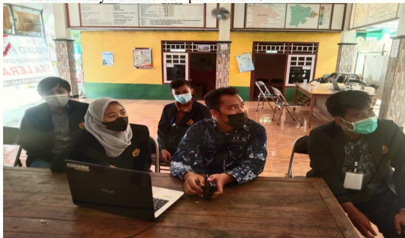
Gambar 2. Pembahasan Program Kerja bersama Perangkat Desa

Perencanaan program kerja pengabdian kepada masyarakat ini meliputi observasi permasalahan yang terjadi di Desa Leran dengan mendiskusikan bersama Perangkat Desa serta menyusun beberapa program yang akan dilakukan kepada sasaran. Sektor UMKM menjadi yang sangat terdampak akibat COVID-19, menjadi salah satu alasan yang diambil mengenai topik yang telah ditetapkan yakni pemberdayaan wirausaha masyarakat terdampak covid-19