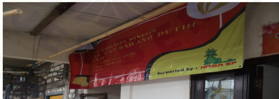
Gambar 7. Pemasangan Banner

Untuk meningkatkan penjualan kami melakukan pengenalan terhadap marketplace kepada sasaran terkait dalam memasarkan produk. Dalam hal ini kami mendaftarkan akun marketplace dan memberikan arahan mengenai fitur-fitur dalam aplikasi sehingga sasaran dapat melakukan pengelolaan pemasaran secara mandiri melalui digital marketing . Diharapkan dalam hal ini penjualan dapat meningkat dan memperluas proses penjualan.