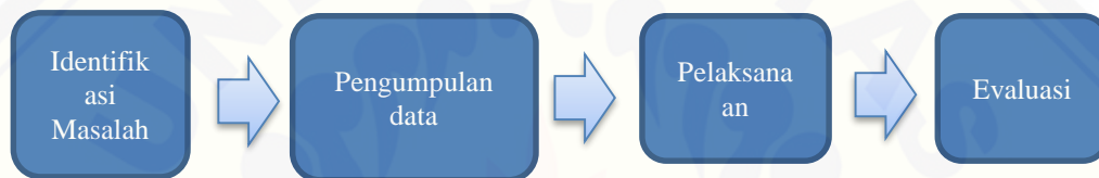
Gambar 1. Tahapan Program Pemberdayaan Wirausaha

Pelaksanaan Program Pemberdayaan Wirausaha Masyarakat terdampak COVID-19 di Desa Leran mempunyai beberapa tahapan antara lain: identifikasi masalah, pengumpulan data, pelaksanaan, dan evaluasi.