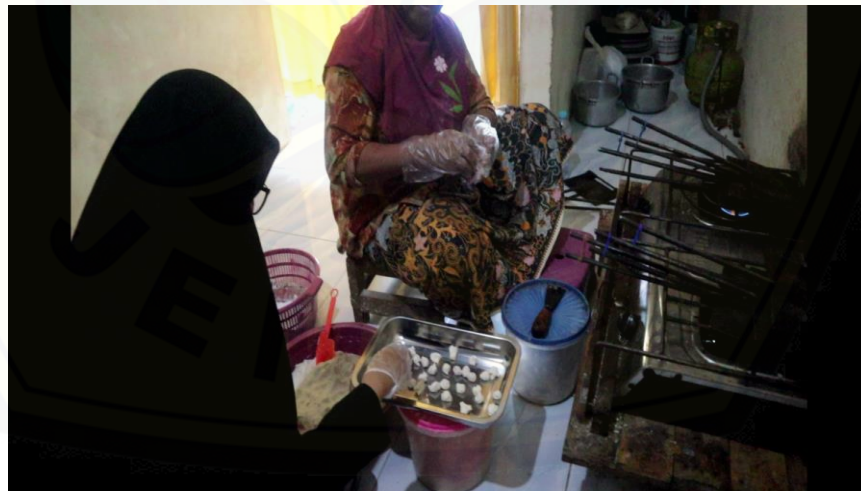
Gambar 4. Proses pengolahan produk menggunakan sarung tangan

Pada minggu kedua penulis melaksanakan kegiatan pendampingan dan pemberdayaan UMKM. Dalam hal ini memberikan masukan terkait pengembangan kualitas produk agar sasaran dapat menerapkan tentang kebersihan saat proses produksi. Awalnya proses produksi hanya dilakukan seadanya dengan menggunakan tangan, kemudian dijelaskan untuk memberikan kualitas produk yang sehat sasaran harus menggunakan sarung tangan dalam proses pengolahannya agar kualitas produk terjaga. Dalam pengemasan produk juga dilakukan menggunakan alat press, sehingga menjaga kualitas produk tetap awet.