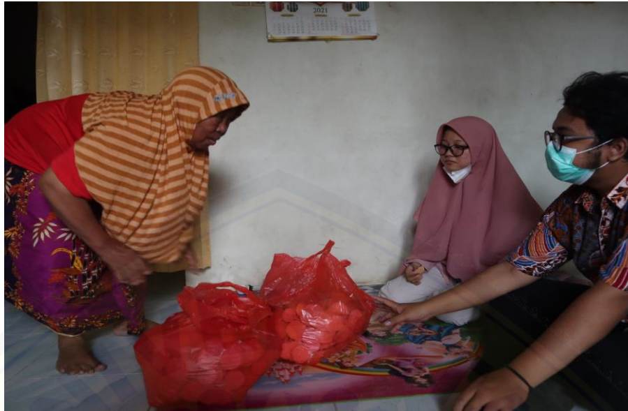
Gambar 3. Pemetaan Kondisi UMKM Opak

Pada minggu kedua penulis melaksanakan kegiatan pendampingan dan pemberdayaan UMKM. Dalam hal ini memberikan masukan terkait pengembangan kualitas produk agar sasaran dapat menerapkan tentang kebersihan saat proses produksi. Awalnya proses produksi hanya dilakukan seadanya dengan menggunakan tangan, kemudian dijelaskan untuk memberikan kualitas produk yang sehat sasaran harus menggunakan sarung tangan dalam proses pengolahannya agar kualitas produk terjaga. Dalam pengemasan produk juga dilakukan menggunakan alat press, sehingga menjaga kualitas produk tetap awet.