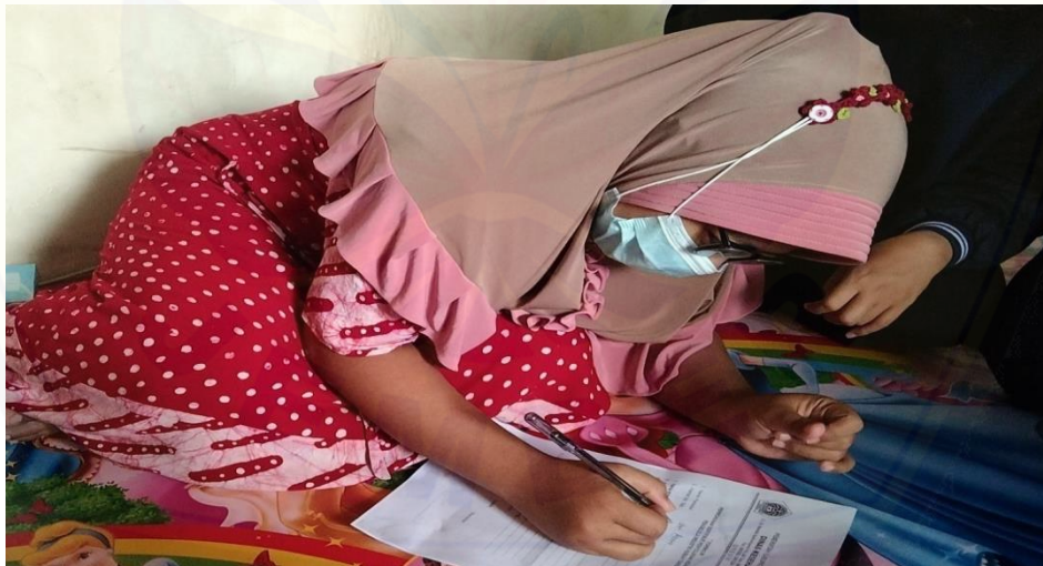
Gambar 9. Proses melengkapi persyaratan PIRT oleh pelaku usaha

Terkait dalam meningkatkan nilai jual produk, serta keamanan dan mutu produk yang terjamin, sehingga produk dapat dipasarkan ke toko modern ( supermarket ) dan memunculkan kepercayaan masyarakat meningkat. Kami melakukan pendaftaran sertifikat perizinan pangan industri rumah tangga (PIRT). Karena jika produk pangan yang diproduksi telah memiliki izin PIRT pemasaran produk dapat dipasarkan secara luas.