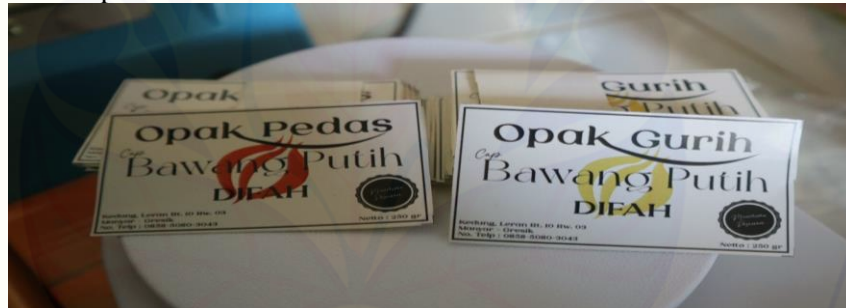
Gambar 6. Logo baru opak