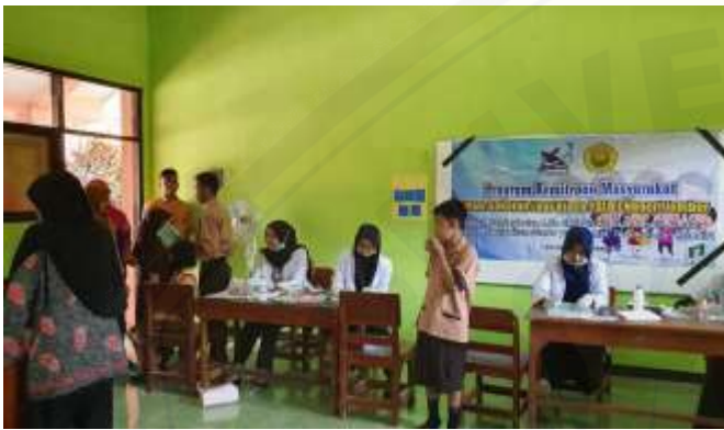
Gambar 3. Penyuluhan dan pemeriksaan kesehatan umum dan kesehatan gigi mulut