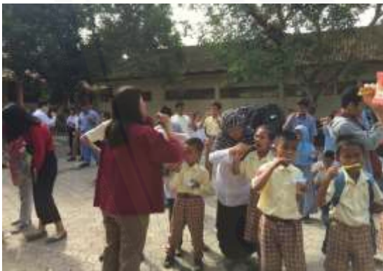
Gambar 4. Pelatihan menyikat gigi