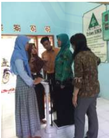
Gambar 5. Pelatihan Kader Kesehatan Siswa

Berdasarkan data kesehatan umum dan kesehatan rongga mulut, profil kesehatan umum siswa SLB Negeri Jember cukup bagus, namun kesehatan rongga mulutnya masih buruk dan membutuhkan perawatan dari tenaga kesehatan. Sebagian besar anak berkebutuhan khusus membutuhkan tindakan perawatan gigi untuk mengatasi masalah giginya, namun anak-anak tersebut sering terlambat mendapatkan perawatan gigi dan bahkan tidak pernah mendapatkan perawatan gigi (Octiara dkk, 2018).