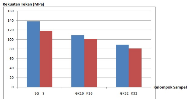
Gambar 1. Histogram rerata hasil uji kekuatan tekan resin komposit microhybrid

Hasil penelitian merupakan nilai kekuatan tekan resin komposit microhybrid pada masing-masing kelompok sampel. Nilai rata-rata hasil pengukuran disajikan pada Gambar 1. Berdasarkan nilai pengukuran kekuatan tekan resin komposit microhybrid menunjukkan bahwa nilai rerata paling tinggi pada kelompok SG dengan rerata sebesar 137,89 MPa. Sedangkan rerata kekuatan tekan paling rendah pada kelompok K32 dengan rerata sebesar 81,0325 MPa. Hasil pengukuran kekuatan tekan pada masing-masing kelompok bervariasi yang disajikan pada diagram batang (Gambar 1), dapat dilihat bahwa semakin lama perendaman dalam larutan kopi murni maka kekuatan tekan akan menurun.