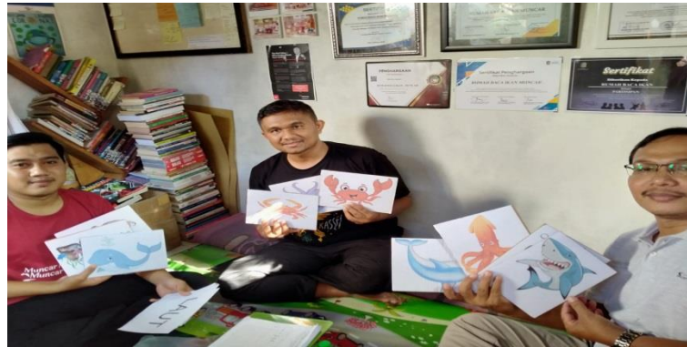
Gambar 2. Beberapa contoh media berbasis literasi bahari berupa jenis ikan

Ketiga, pada FGD tersebut juga telah disepakati dan diputuskan penyusunan handbook untuk mendokumentasikan, sekaligus memublikasikan media/alat peraga berbasis literasi bahari tersebut. Handbook ini pada jangka panjang diharapkan dapat disebar dan dapat memberi dampak positif bagi pembelajaran, khususnya anak SD dalam skala yang lebih luas.