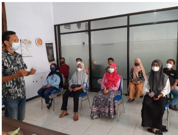
Gambar 3. Pelatihan Cara Membedakan Jenis Kelamin Lobster

Benih lobster di dapat dari SMK kelautan puger Kabupaten Jember dengan garga per ekor dengan 3-4 cm seharga 8000 rupiah. Pemberian benih lobster per peserta sebanyak 2 pasang, dan selain itu juga diberikan pakan pellet sebagai modal dasar minat peserta dalam budidaya lobster. Pendampingan dilakukan sepanjang waktu pengabdian dan setelah pengabdian berlangsung dapat melalui media telpon, whatsapp atau media lain yang dapat meningkatkan kemandirian dalam mengembangkan budidaya lobster air tawar.