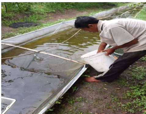
Gambar 1. Kolam Budidaya Ikan Air Tawar

didukung oleh wilayah desa yang dialiri air irigasi dan kondisi wilayah cekungan sehingga untuk kebutuhan penyediaan air sangat mudah (Muhammad Junaidi et al., 2020; Muhammad Junaidi et al., 2021). Perikanan menjadi sektor utama yang menjadi lokomotif perekonomian penduduk dalam mendorong pembangunan di desa ini.