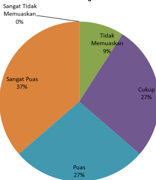
Gambar 6. Hasil Kuisioner Keberlanjutan Program

Hasil pengamatan terkait kemanfaatan program pengabdian terkait Pemberdayaan Masyarakat Desa Sukamakmur Kabupaten Jember Dalam Budidaya Lobster Air Tawar, peserta sangat puas terhadap materi sebesar 64%, kategori puas sebesar 27%, kategori cukup puas 9%, dan sisanya kategori tidak memuaskan dan tidak sangat memuaskan. Sedangkan hasil keberlanjutan program 37% mendukung kegiatan dengan presentase 37% sangat puas, 27% puas, 27% cukup, dan 9% tidak memuaskan. Kuisioner tersebut menunjukkan bahwa materi budidaya lobster dalam meningkatkan taraf hidup masyarakat melalui animo masyarakat dan perangkat Desa Sukamakmur dalam mendukung pengabdian masyarakat ini. Diharapkan dengan selesainya program ini, keberlanjutan yang didukung dengan kuisioner dapat terus dilakukan secara luas, sehingga tujuan dalam meningkatkan taraf hidup masyarakat meningkat.