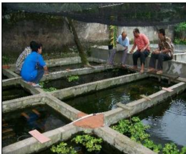
Gambar 4. Penyebaran Bibit Lobster

Pendampingan dapat meningkatkan pemahaman peserta dalam penanganan masalah yang timbul dalam proses budidaya lobster air tawar.