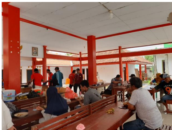
Gambar 2. Pelaksanaan Sosialisasi Pengabdian masyarakat

sepanjang hayat. Pelatihan dilakukan dengan pemberian brosur dan praktek langsung dalam melihat morfologi lobster baik jantan maupun betina, perawatan kolam sebagai media budidaya yang baik untuk lobster, dan memberikan makanan lobster baik waktu dan jenis makanan yang bernutrisi tinggi.