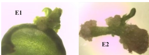
Gambar 2. Tunas yang muncul pada 16 HST pada perlakuan B1A3E1 (BAP 1 mg L -1 + IAA 0.3 mg L -1 + jenis eksplan kotiledon) dan B1A3E2 (BAP 1 mg L -1 + IAA 0.3 mg L -1 + jenis eksplan hipokotil)

Keterangan: Angka yang diikuti oleh huruf yang sama pada kolom yang sama menunjukkan berbeda tidak nyata berdasarkan uji jarak berganda Duncan pada taraf 5%. (B0:BAP 0 ppm, B1:BAP 1 ppm, B2:BAP 2 ppm, B3:BAP 3 ppm), (A0: IAA 0 ppm, A1: IAA 0.1 ppm, A2: IAA 0.2 ppm, A3: IAA 0.3 ppm), (E1: eksplan kotiledon, E2: eksplan hipokotil, E3: eksplan akar)