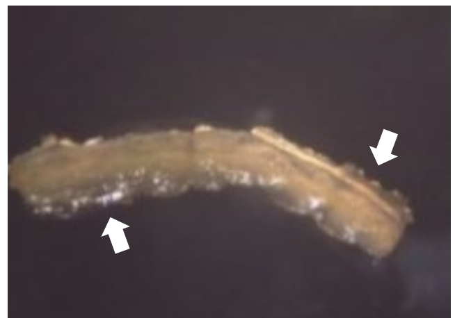
Gambar 1. Kalus yang muncul di tepi eksplan akar pada 6 HST (tanda panah) pada perlakuan B_1A_1E_3 = BAP 1 mg L -1 + IAA 0.1 mg L -1 + jenis eksplan akar

jaringan tersebut terdapat hormon pertumbuhan yang masih aktif sehingga dapat membantu perkembangan jaringan sehingga mampu menghasilkan daya regenerasi yang tinggi. Menurut Henuhili (2013), menyatakan bahwa eksplan kotiledon dan hipokotil merupakan bagian tanaman yang masih aktif membelah (jaringan meristem). Penambahan konsentrasi BAP dan IAA dapat menunjang kinerja eksplan dalam memacu pertumbuhan eksplan dengan cepat, akan tetapi semakin tinggi konsentrasi konsentrasi BAP dan IAA juga tidak menjamin tunas muncul lebih cepat. Hal ini diduga karena masing-masing eksplan memiliki kandungan hormon endogen yang berbeda, sehingga setiap jenis eksplan memiliki kemampuan yang berbeda dalam merespon penambahan ZPT pada konsentrasi tertentu. Oleh sebab itu, kecepatan pertumbuhan eksplan dalam menghasilkan tunas, ditentukan oleh kombinasi hormon endogen dengan ZPT. IAA yang diberikan secara tunggal, tidak akan mempengaruhi variabel pertumbuhan yang diamati, akan tetapi jika diimbangi dengan BAP akan membantu mempercepat proses awal muncul tunas (Samanhudi et al. , 2021). Cepat atau lambat munculnya tunas mempengaruhi jumlah tunas yang muncul.