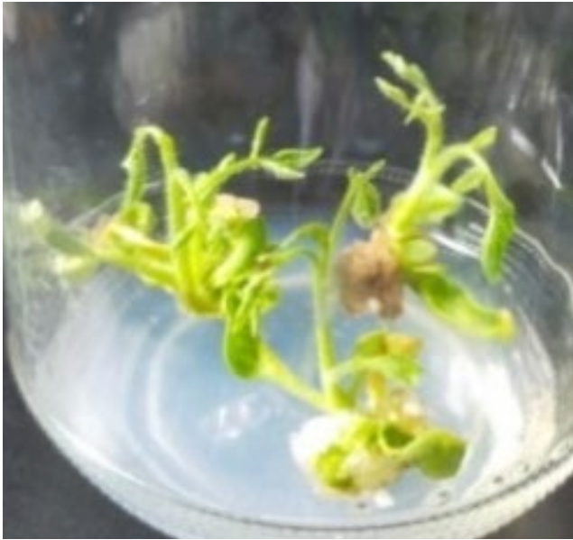
Gambar 3. Tunas pada perlakuan B2A3E1 (BAP 2 mg L -1 + IAA 0.3 mg L -1 + kotiledon) umur 60 HSI

sitokinin (Mayrendra et al. , 2022). Pembentukan akar tersebut terjadi karena adanya pergerakan auksin dari pusat sintesa auksin (tunas) menuju bagian bawah tanaman. Rooting cofactor dan karbohidrat yang terdapat pada tanaman akan berkumpul dengan auksin (NAA) di daerah pelukaan eksplan, kemudian mendorong sel-sel membentuk akar melalui proses diferensiasi sel.