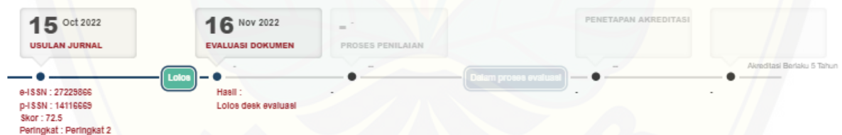
Gambar 2. Reakreditasi MIMS ke Arjuna