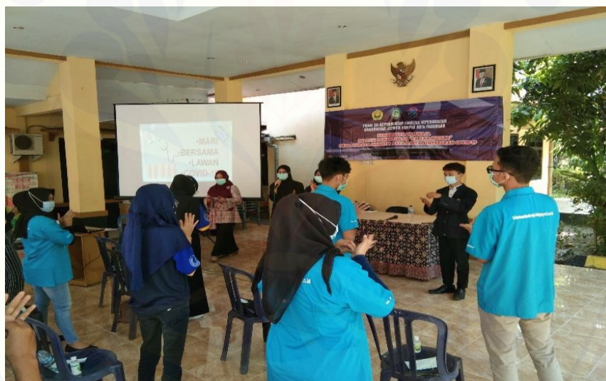
Gambar 4. Pelatihan Cuci Tangan 6 Langkah

Setelah materi disampaikan, dilakukan pelatihan penggunaan masker dan cuci tangan 6 langkah dengan benar. Pemateri mendemonstrasikan teknik yang benar dengan diikuti oleh seluruh peserta kegiatan PKM.