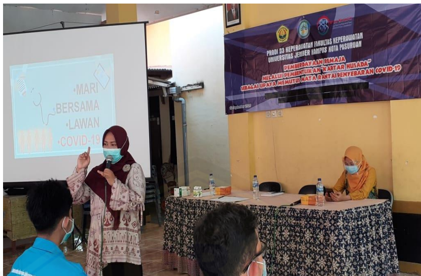
Gambar 3. Penyampaian Materi

Setelah materi disampaikan, dilakukan pelatihan penggunaan masker dan cuci tangan 6 langkah dengan benar. Pemateri mendemonstrasikan teknik yang benar dengan diikuti oleh seluruh peserta kegiatan PKM.