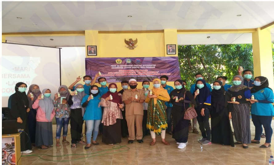
Gambar 7. Pemateri, Peserta dan Lurah Tembokrejo

Kegiatan ketiga yang dilaksanakan merupakan kegiatan inti yaitu pembentukan Karang Taruna Husada (Kartar Husada) yang beranggotakan para remaja di wilayah Kelurahan Tembokrejo. Pembentukan Kartar Husada selanjutnya disahkan oleh Lurah Tembokrejo dan Camat Purworejo. Kegiatan diakhiri pembacaan do'a dan pembagian hand sanitizer dan masker kepada peserta.