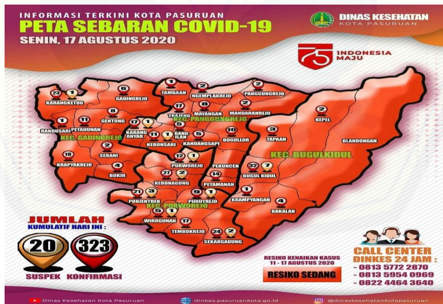
Gambar 1. Peta Sebaran Covid-19 di Wilayah Kota Pasuruan

Dalam penanganan kasus Covid-19, perawat dan tenaga medis menjadi garda terdepan. Namun untuk mengatasi permasalahan yang terjadi dibutuhkan kerjasama dari semua elemen di masyarakat termasuk para generasi muda (Adelia et al., 2020). Generasi muda, sebagai sosok yang muda, dinamis, penuh energi, optimis, diharapkan dapat menjadi agent of change yang bergerak dan berusaha untuk ikut membantu pemerintah dalam memutus rantai penyebaran covid-19 (Yunitasari & Putri, 2020). Pemberdayaan remaja melalui pembentukan “Kartar Husada” (Karang Taruna Husada) diharapkan mampu menjadi salah satu upaya nyata dalam memutus mata rantai penyebaran Covid-19. Bentuk kegiatan pengabdian masyarakat ini bersifat menggali potensi yang ada pada masyarakat khususnya remaja agar berdaya, bergerak, berubah dan mampu untuk berperan dalam memutus mata rantai penyebaran Covid-19 (Agustino, 2020). Melalui pembentukan “Kartar Husada” diharapkan para remaja dapat menjadi katalisator untuk meningkatkan kesadaran masyarakat dalam mematuhi protokol kesehatan.