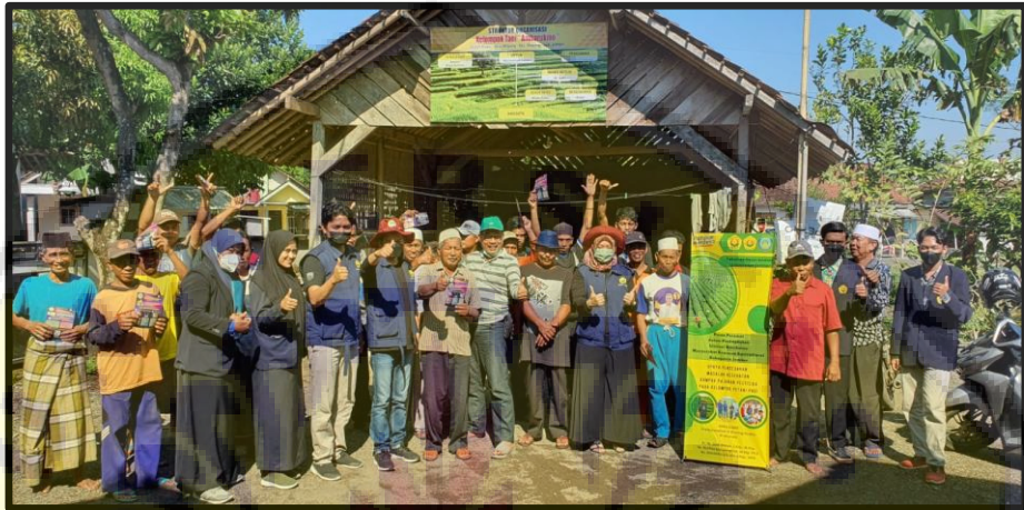
Gambar 3. Pembentukan Kader Petani Sehat (PESAT) di Desa Mayang Kecamatan Mayang Kabupaten Jember Tanggal 11 September 2022.

Program kegiatan pengabdian desa binaan berlangsung selama 1 (satu) bulan selama bulan September 2022 dengan melibatkan 50 peserta anggota kelompok tani. Partisipasi mitra dalam kegiatan ini sebagai peserta dan menghimpun partisipasi anggota kelompok tani untuk bersedia menjadi kader PESAT. Kehadiran peserta dalam kegiatan ini mencapai 100%. Adapun hasil kegiatan terinci sebagai berikut: