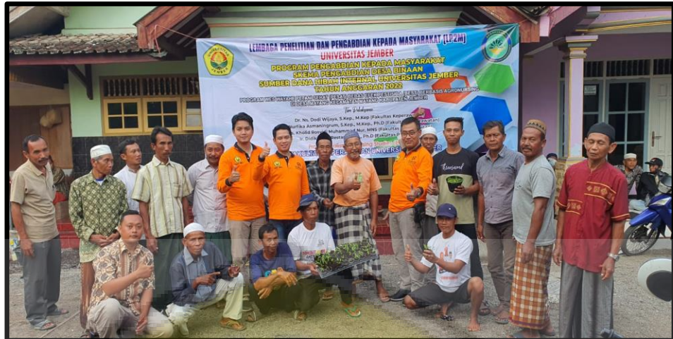
Gambar 5. Kader Petani Sehat (PESAT) di Desa Mayang Kecamatan Mayang Kabupaten Jember. Tanggal 25 September 2022