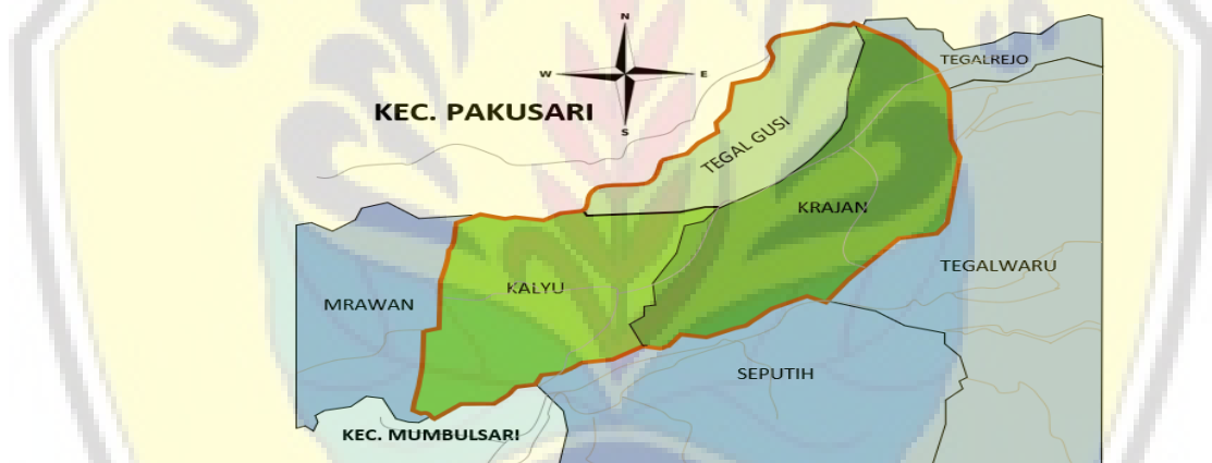
Gambar 1. Peta Wilayah Desa Mayang, Kecamatan Mayang, Kabupaten Jember