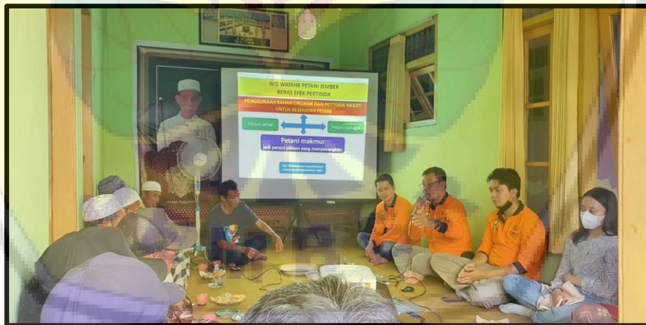
Gambar 4. Capacity Building Kader Petani Sehat (PESAT) di Desa Mayang Kecamatan Mayang Kabupaten Jember. Tanggal 25 September 2022.