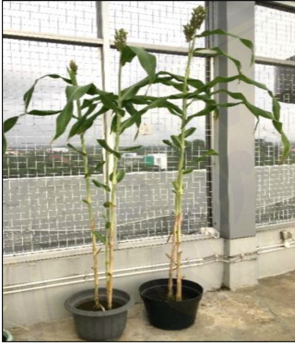
Gambar 1. Tanaman Sorghum bicolor Usia 4 Bulan

ekstrim (Tari et al. , 2013). Produksi sorgum sekitar 70 juta ton dimanfaatkan oleh 500 juta orang di kurang dari 30 negara (Damardjati et.al. , 2013). Selain menjadi sumber penting pangan, sorgum juga dimanfaatkan untuk diversifikasi bahan pangan, dan biofuel (Efendi et al. , 2013; Suarni, 2009). Oleh karena itu, diharapkan sorgum memainkan peran yang semakin penting dalam memenuhi tantangan bahan pangan bagi populasi dunia yang terus berkembang di bawah ancaman perubahan iklim global (Tao et al. , 2020)