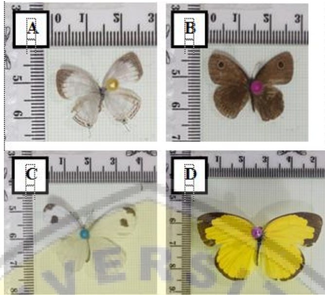
Gambar 1. Empat spesies kupu-kupu yang paling banyak ditemukan pada area penelitian, yaitu (A) Jamides pura , (B) Ypthima Philomela , (C) Leptosia nina , dan (D) Eurema hecabe