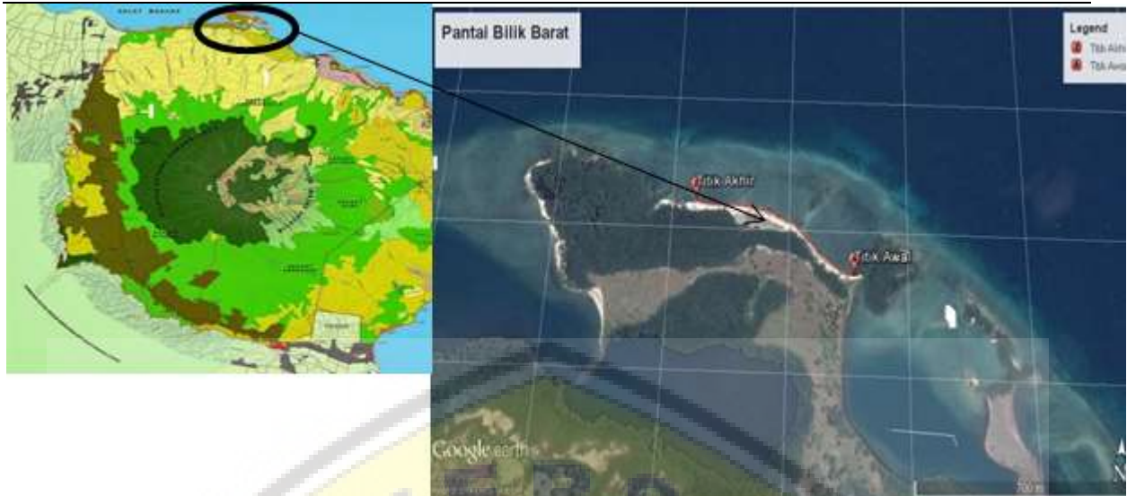
Gambar 1. Peta Lokasi Tanjung Bilik, Taman Nasional Baluran (Balai TN Baluran, 2019).