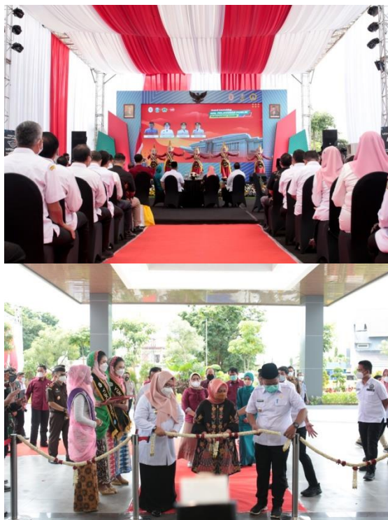
Gambar 2: Kegiatan Grand Launching Mal Pelayanan Publik sedang Berlangsung

Sepanjang acara panitia saling bekerja sama menyelesaikan tanggung jawabnya, saling menutupi kekurangan jika terdapat pekerjaan yang belum baik pengerjaannya. Tidak ada satupun panitia yang terlihat santai, semuanya menjalankan tugasnya secara serius. Hal inilah yang membuat CV. Imagine Promosindo dapat bersaing dengan event organizer yang lain. Berkat sikap tanggap, disiplin dan detail penyelenggaraan setiap event mampu berjalan dengan sangat baik, tidak mengecewakan konsumen.